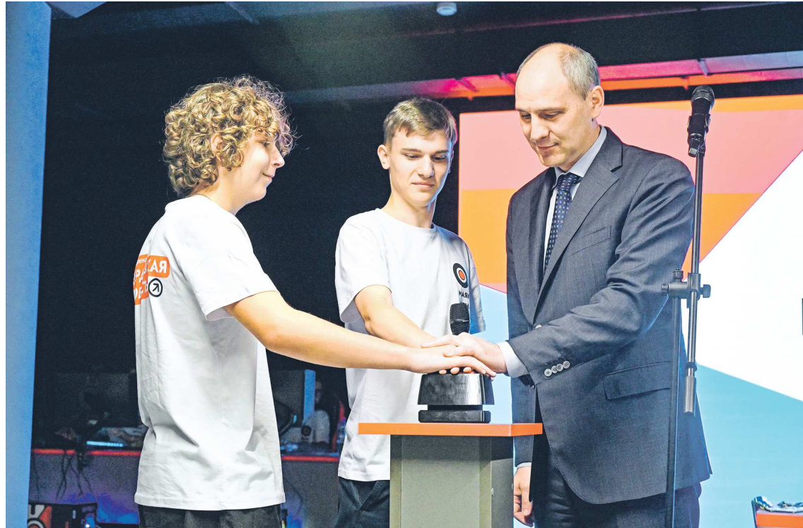
Момент символического нажатия кнопки и старта Школьной свердловской киберспортивной лиги

Руководитель Свердловской области осмотрел оба этажа здания. На одном из них