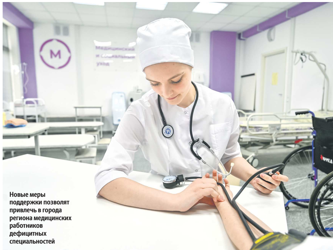
Новые меры поддержки позволят привлечь в города региона медицинских работников дефицитных специальностей