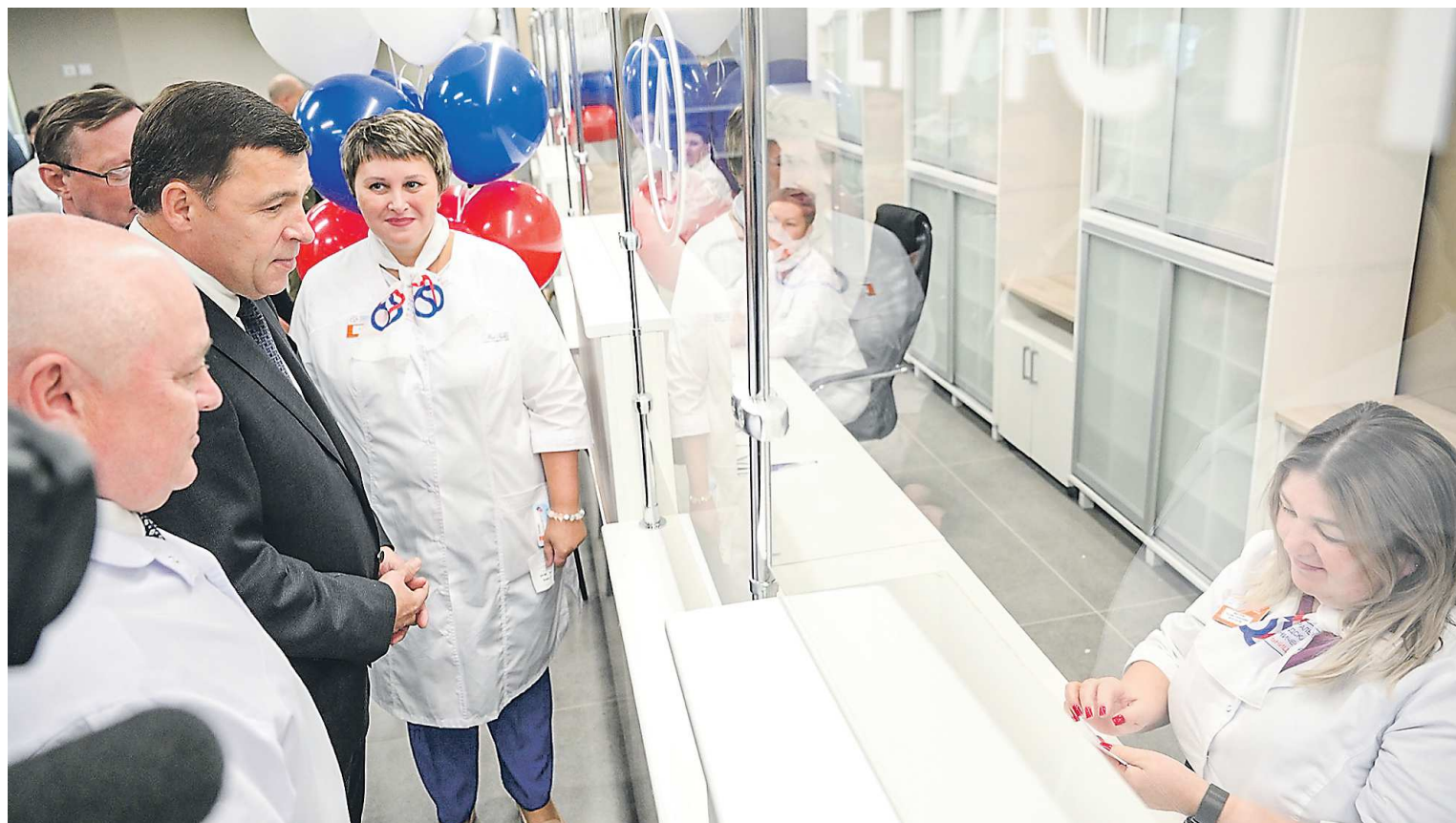
Открытие современной поликлиники в Академическом, рассчитанной на 1 200 посещений в сутки, стало настоящим праздником для жителей самого молодого района уральской столицы

Свердловская область вошла в число лидеров по количеству объектов, возводимых с использованием инфраструктурных кредитов