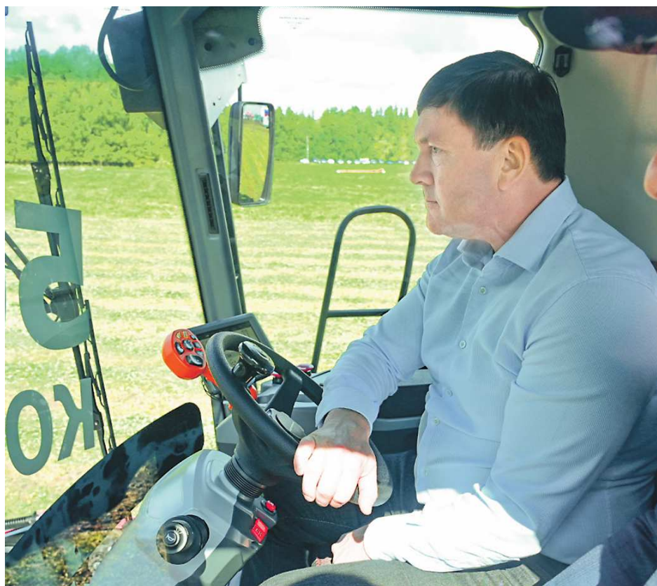
Высокотехнологичную технику испытал первый заместитель губернатора Свердловской области Алексей Шмыков

Отметим, что на государственную поддержку сельхозпроизводителей в 2025 году предусмотрено 4,8 миллиарда рублей. Субсидии получили почти 300 предприятий.