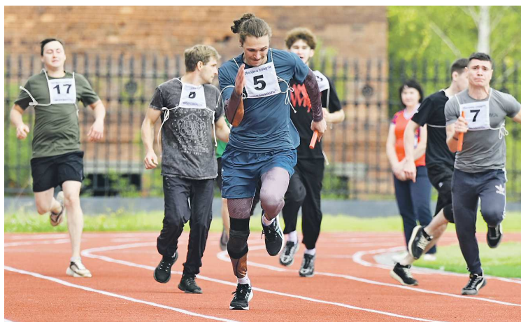
ДЕПАРТАМЕНТ ИНФОРМАЦИОННОЙ ПОЛИТИКИ СВЕРДЛОВСКОЙ ОБЛАСТИ

Реконструкция Центра молодежных инициатив длилась два года и проведена на средства гранта Росмолодежи за победу в конкурсе «Регион для молодых».