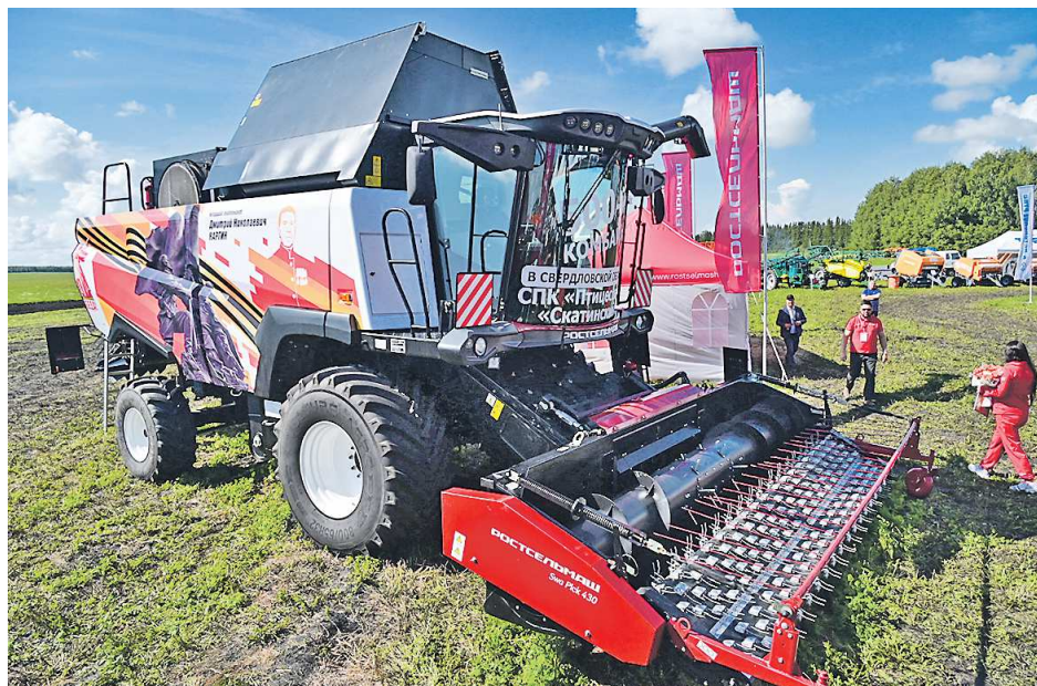
Зерноуборочный комбайн изготовлен заводом Тюменьагромаш для уральских сельхозпредприятий

Свои технологии и разработки на семинаре представили ведущие предприятия сельскохозяйственного машиностроения, снабженческие организации, научные и учебные заведения. Всего в экспозициях было задействовано около 150 единиц техники и оборудования. Одним из ключевых экспонатов стал сельскохозяйственный квадрокоптер, разработанный малым инновационным предприятием «Уралагродрон» совместно с Уральским государственным аграрным университетом. Агродрон ХАГ Р100, оснащенный 40-литровым баком, способен обработать до 24 гектаров земли в час. Использование квадрокоптера при поливе пашни обеспечивает экономию воды до 90% и защищает посевы от вытаптывания.