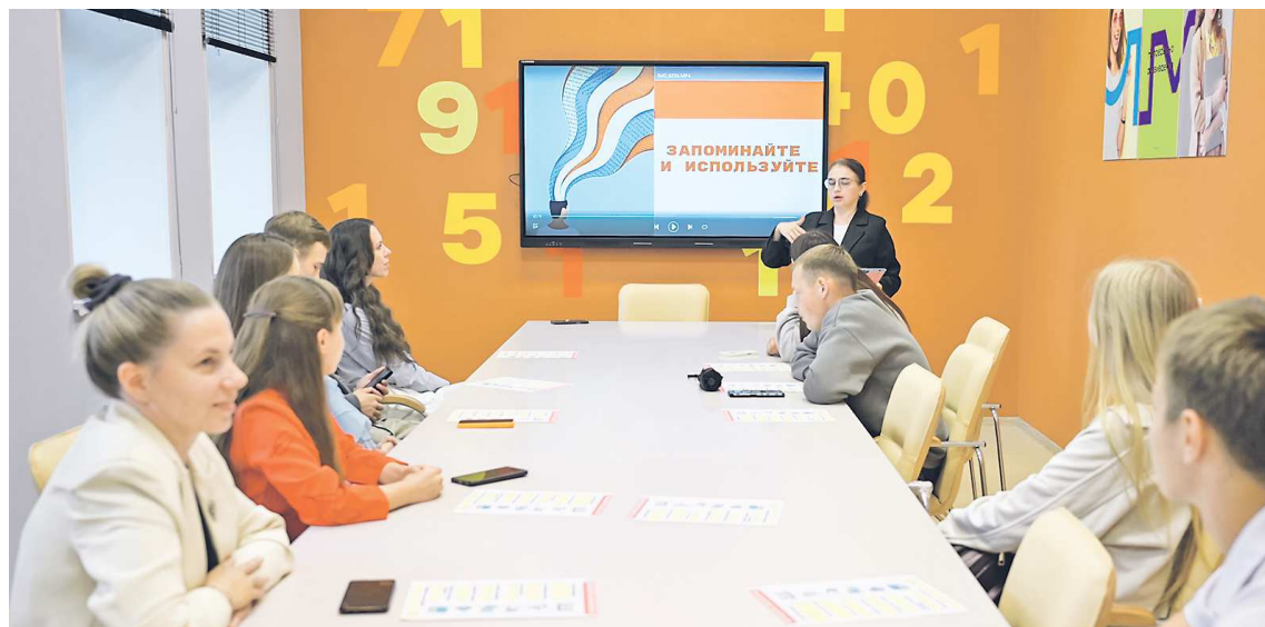
ДЕПАРТАМЕНТ ИНФОРМАЦИОННОЙ ПОЛИТИКИ СВЕРДЛОВСКОЙ ОБЛАСТИ