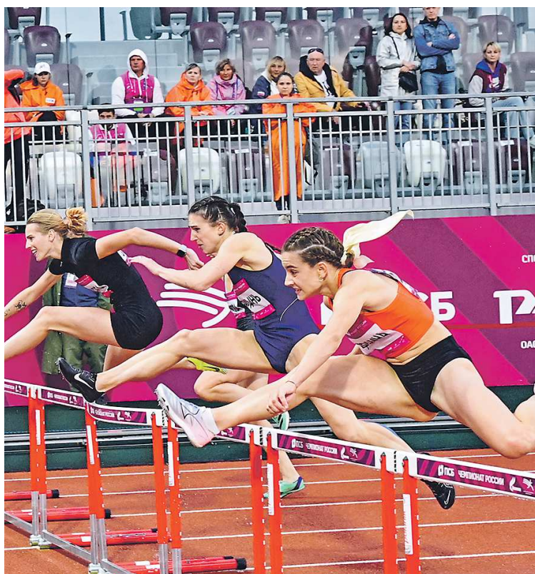
Финалы «Королевы спорта» всегда проходят в упорной борьбе сильнейших легкоатлетов страны

– Это один из самых ярких турниров, который всегда собирает много зрителей. В этом году вход на состязания для всех