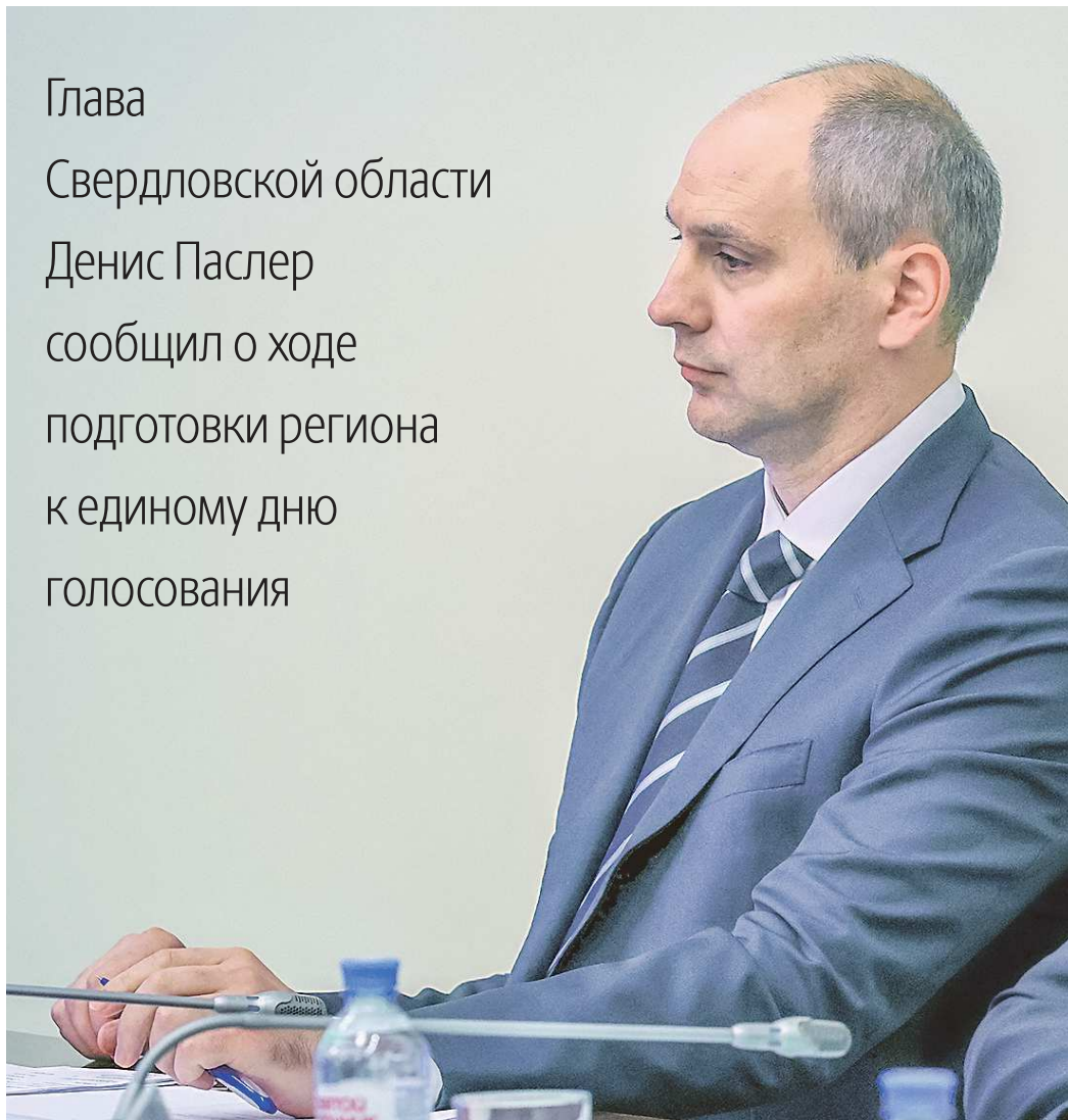
ДЕПАРТАМЕНТ ИНФОРМАТИКИ СВЕРДЛОВСКОЙ ОБЛАСТИ

Глава Свердловской области Денис Паслер сообщил о ходе подготовки региона к единому дню голосования