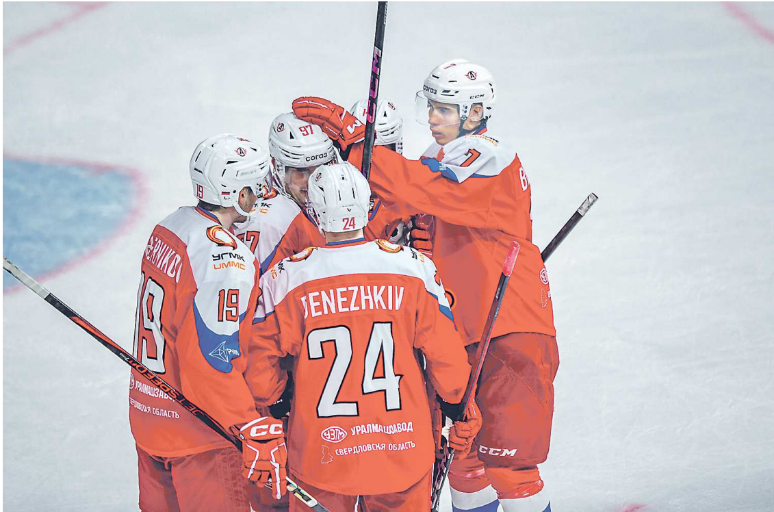
Для «шоферов» матчи в Уфе стали первыми в рамках подготовки к новому сезону