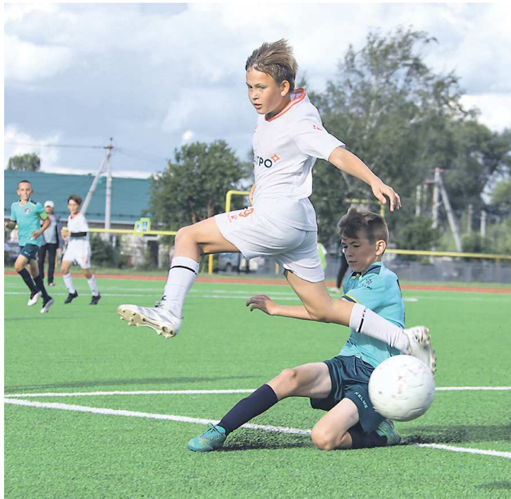
Матчи Кубка Свердловской области получились яркими, никто не хотел уступать и сантиметра поля