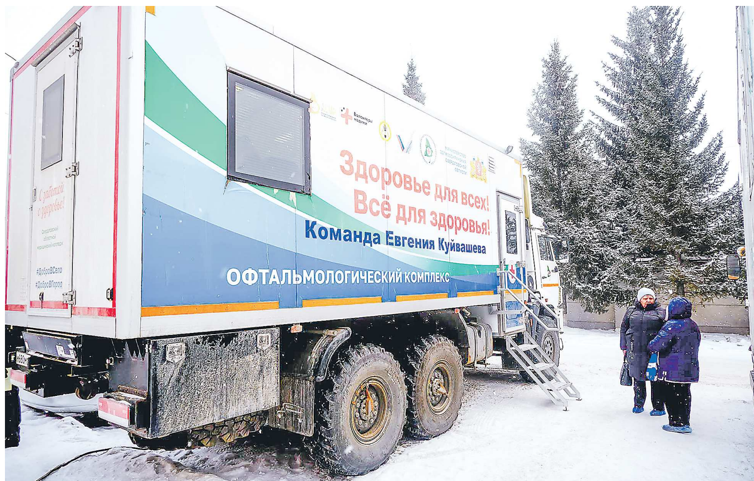
Системная реализация профилактического проекта «Дорога в село» помогла 10,3 тысячи свердловчан пройти комплексное обследование здоровья по месту жительства в 2024 году

миллиона рублей планируется потратить на капитальный ремонт 82 объектов здравоохранения