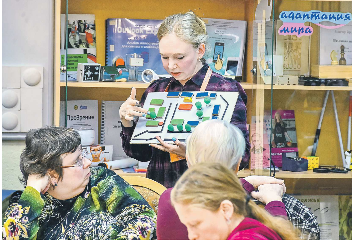
Выставка «Смотри шире» демонстрирует не только историю ВОС, судьбы талантов, но и приборы, позволяющие людям с проблемами зрения адаптироваться в мире