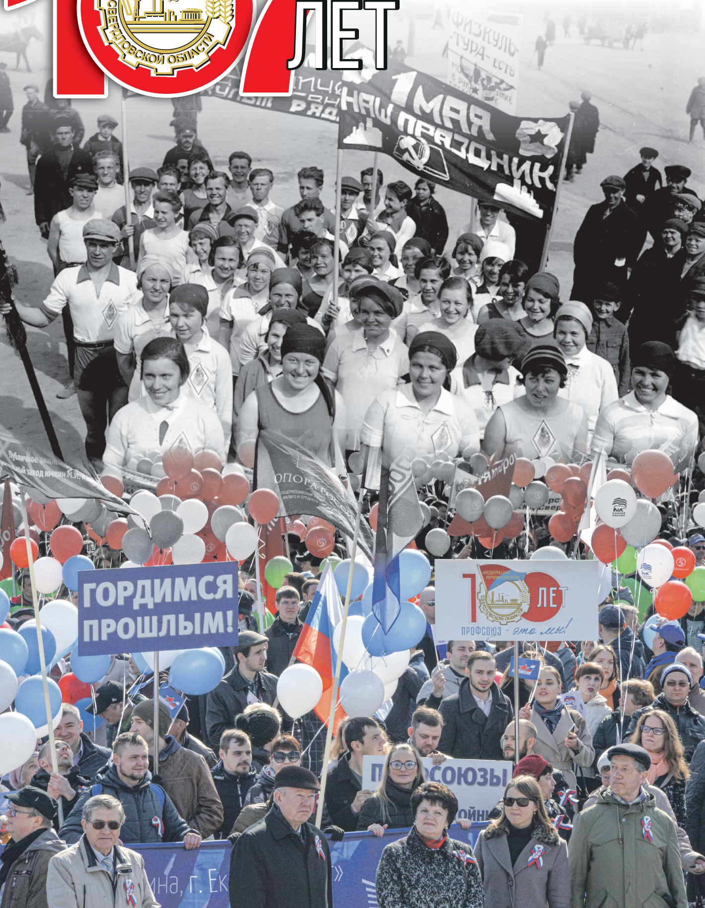
ПАВЕЛ ВОРОЖЦОВ / ГОСАРХИВ СВЕРДЛОВСКОЙ ОБЛАСТИ