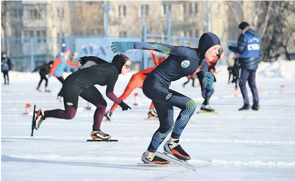
«Лед надежды нашей» является самым массовым конькобежным стартом региона

ПРЕСС-СЛУЖБА МИНИСТЕРСТВА ФИЗИЧЕСКОЙ КУЛЬТУРЫ И СПОРТА РЕГИОНА