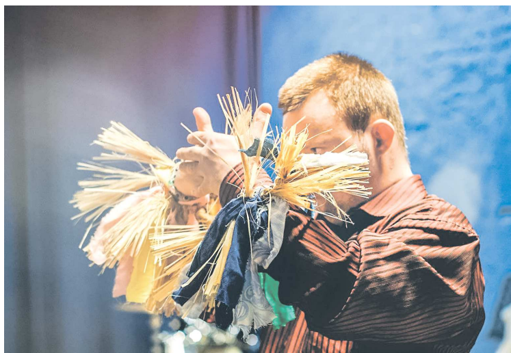
Зрителей спектакля ждет волшебная история о мансийских лесных духах, феях и великанах