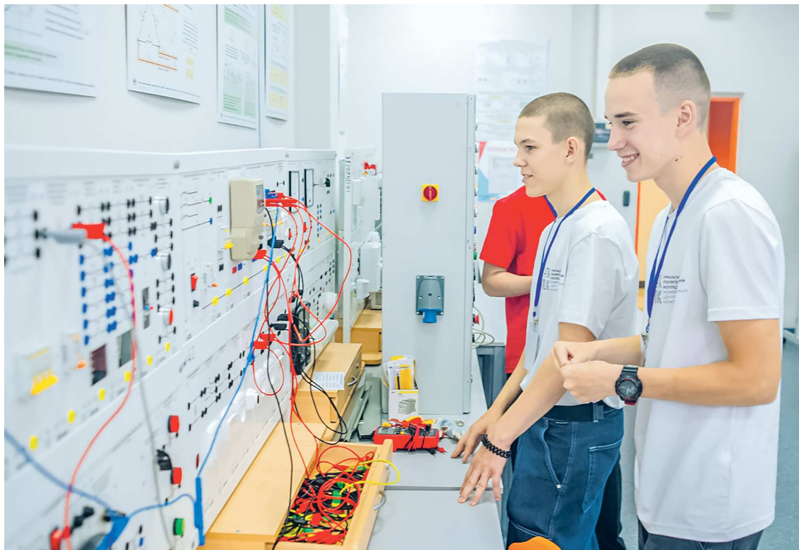
СВЕРДЛОВСКИЙ ПОЛИТЕХНИЧЕСКИЙ КОЛЛЕДЖ

Команда каждой из школ, а их в проекте участвует 44, по итогам занятий подготовит и защитит проект, посвящен-