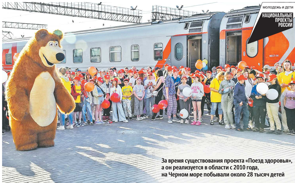
За время существования проекта «Поезд здоровья», а он реализуется в области с 2010 года, на Черном море побывали около 28 тысяч детей

– Многолетний опыт работы, связанный с проведением