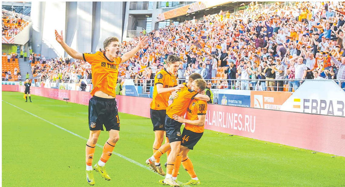
Матч с «Ахматом» стал самым посещаемым для «Урала» в нынешнем сезоне: вместе с футболистами победе клуба радовались 19 679 зрителей на стадионе