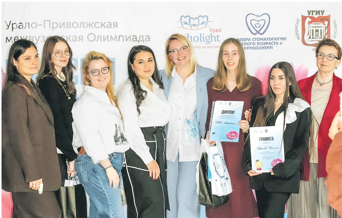
ПРЕДОСТАВЛЕНО ПРЕСС-СЛУЖБОЙ УГМУ