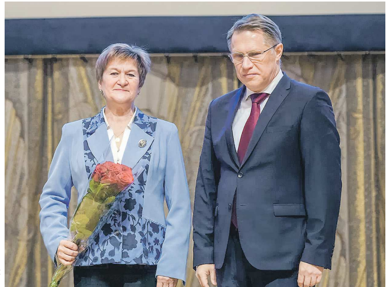
Награда – результат многолетнего труда, профессионализма и преданности делу спасения людей