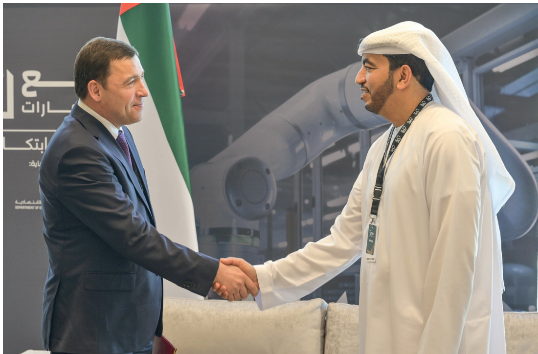
Губернатор Евгений Куйвашев обещал заместителю министра промышленности и передовых технологий ОАЭ Омару Аль Сувейди организовать экскурсии на самые современные производства Среднего Урала

– На долю Свердловской области приходится значительная часть добычи российского ванадия, бокситов, железных руд. У нас работают свыше