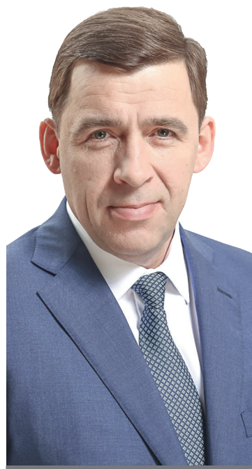
Губернатор Свердловской области