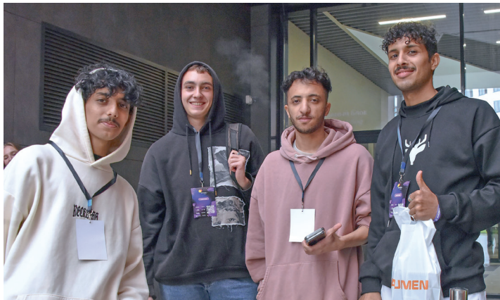
أصبحت المدينة الجامعية لأورفو ذو المستوى العالمي بالفعل جامعة للطلاب من مختلف البلدان. الآن ممثلو دولة الإمارات العربية المتحدة منتظرون هنا

بدورها نائب وزير التربية والتعليم بالإمارات ربيعة السميطي شكرت يفغيني كوفاشيف على الزيارة، وأشارت إلى اهتمامها بتنفيذ المقترحات التي تمت مناقشتها وأعربت عن ثقتها في التطوير المشترك للمشاريع في المجال الإنساني لمنطقة سفيردولوفسك والإمارات.