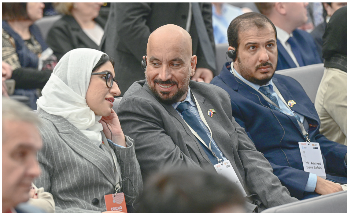
Делегация из ОАЭ находилась в Свердловской области, чтобы оценить достижения региона в сфере инклюзивных технологий