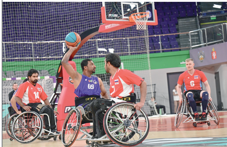
Баскетболисты на колясках продемонстрировали яркую и зрелищную игру

После этого почетные гости мероприятия заняли места на трибунах, как и зрители, и стали наблюдать за спортивными баталиями. Первыми на площадке появились волейболисты. Интересно, что сборная Свердловской области и команда ОАЭ образовали две смешанные команды, в которых были как свердловские игроки, так и арабские. Несмотря на то что матч был товарищеским и дружеским, азарт и спортивную составляющую никто не отменял, в каждом розыгрыше была упорная борьба, а сами розыгрыши были яркими и интересными. В итоге с небольшим перевесом победу одержала команда красных.