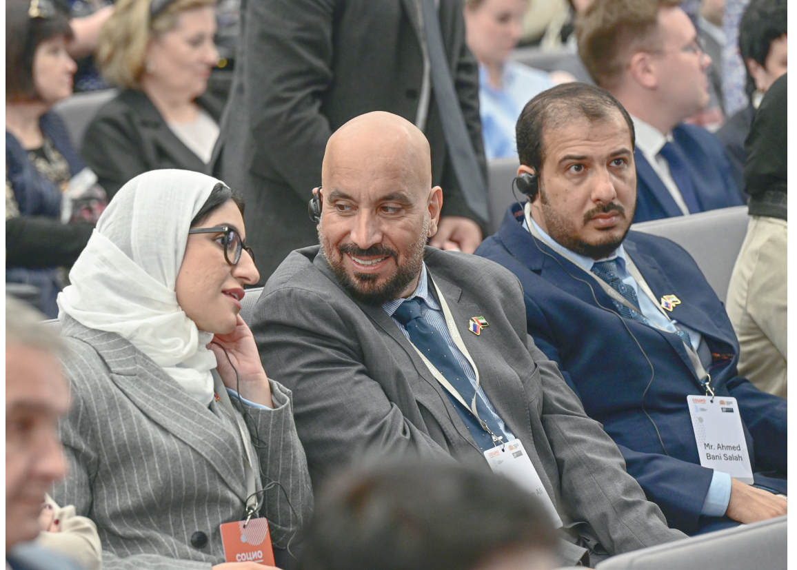
وفد من دولة الإمارات يزور منطقة سفيردولوفسك لتقييم إنجازات المنطقة في مجال التقنيات الشاملة

في يكاترينبرغ افتتح المنتدى والمعرض الدولي الثالث للتكنولوجيات الاجتماعية «SOCIO»