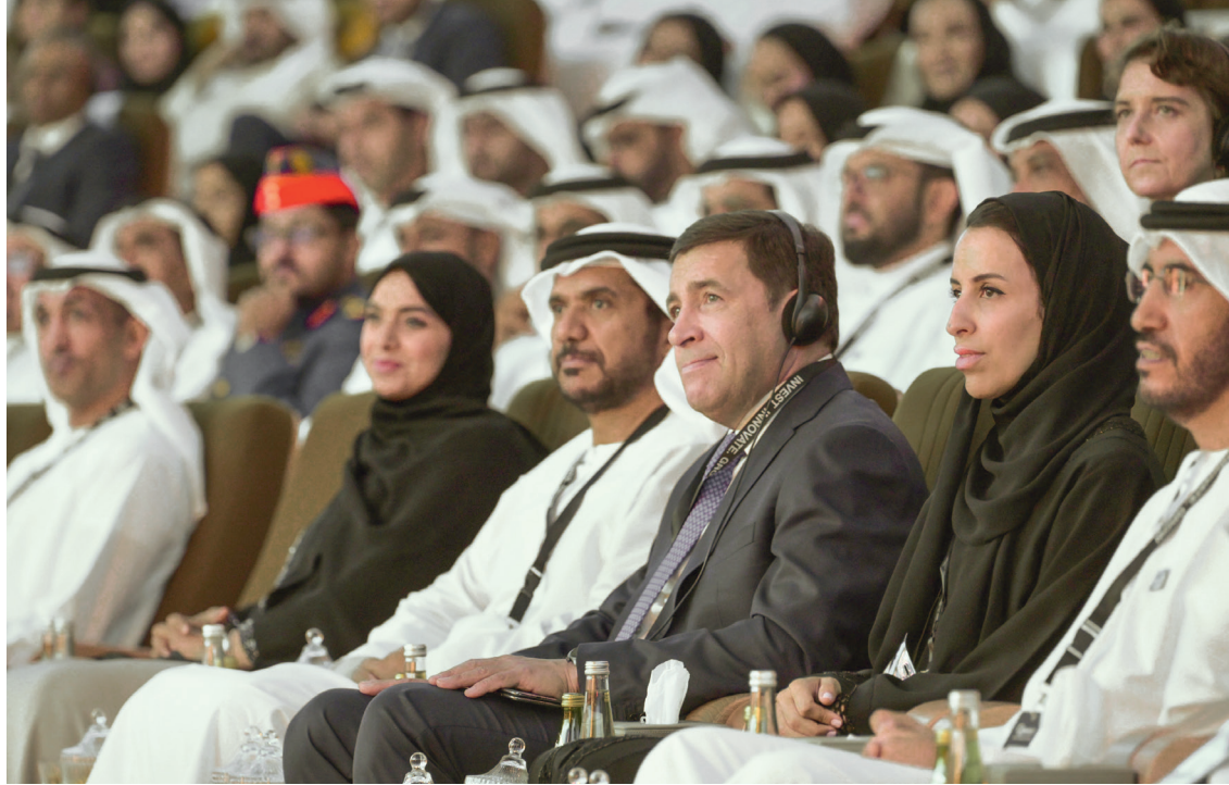
يوم الاثنين ٢٧ مايو شارك محافظ المنطقة في حفل افتتاح منتدى «إصنع في الإمارات» وفي جلسة عامة حول آفاق التطوير في الصناعة.

تركز زيارة وفد سفيردوفسك على تعزيز التعاون مع الشركاء الأجانب والاستعداد لمعرض إنوبروم-٢٠٢٤ حيث إن الدولة الشريكة هي الإمارات. تحدث في منتدى الصناعة المحافظ يفغيني كوفياشيف عن إمكانيات منطقة سفيردوفسك، وأعلن عزمه على تعزيز التعاون مع الشركاء من الإمارات، ووعده بتنظيم جولة للوفد الإماراتي إلى أحدث مصانع وسط الأورال والتي قد تثير اهتمامهم. تمثل منطقة سفيردوفسك جزءاً كبيراً من إنتاج الفاناديوم والبوكسيت وخامات الحديد الروسية. وقال يفغيني كوفياشيف إنه في هذه المنطقة أكثر من ١٢ ألف مؤسسة صناعية، كما أن الصناعات الأساسية في المنطقة هي