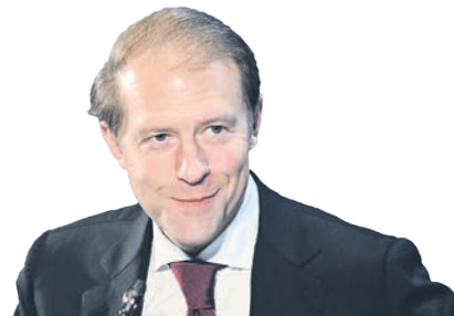
Денис МАНТУРОВ, заместитель председателя Правительства России – министр промышленности и торговли РФ

“ Я хочу поблагодарить каждого из вас, кто заинтересованно развивает российскую промышленность в разных сегментах. Уверен, что вы воспользуетесь сегодняшними вызовами – хотя мы говорим о них как о возможностях – чтобы реализовать себя. Сегодня есть достаточно широкий инструментарий, который позволяет реализовывать и масштабные, и среднего размера проекты, и стартапы. Поэтому на всех этапах ваших задумок можно получить нашу поддержку.