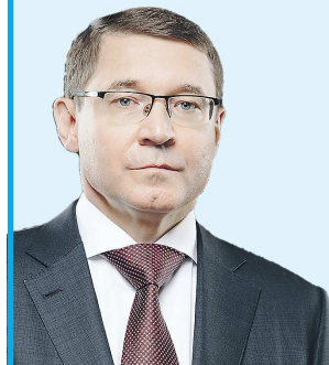
Полномочный представитель Президента России в Уральском федеральном округе

В светлый праздник Пасхи желаю всем уральцам здоровья, счастья, благополучия, добра и процветания!