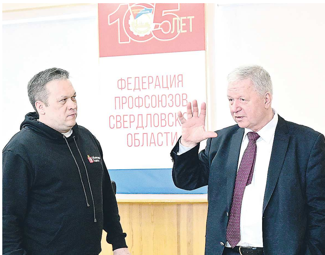
Михаил Шмаков отмечает: обеспеченность экономики страны высококвалифицированными кадрами, получающими достойную зарплату, является одним из главных факторов прогресса

– Одно из важнейших решений – это принятие в декабре 2023 года обновленного федерального закона о занятости