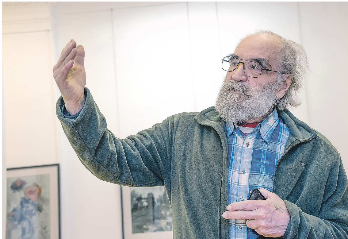
Художник Владимир Кошелев удостоен премии губернатора «За значительный вклад в развитие культуры и искусства Свердловской области»