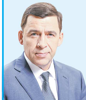
Губернатор Свердловской области Евгений КУЙВАШЕВ