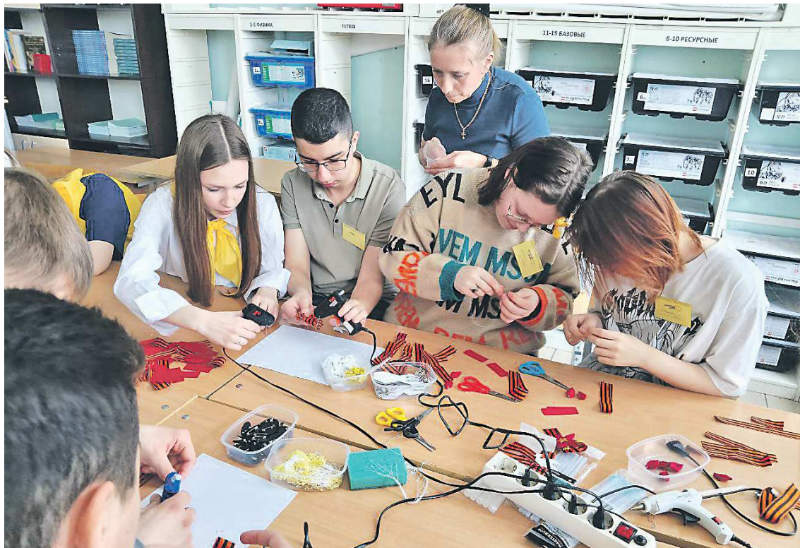
ПРЕСС-ЦЕНТР КОММУНАРСКИХ СБОРОВ