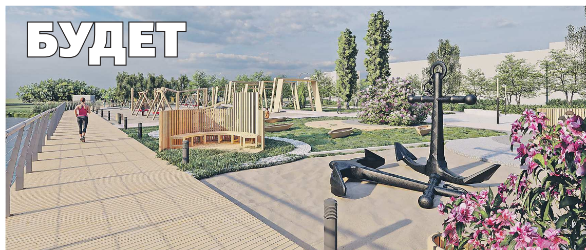
ДИЗАЙН-ПРОЕКТ АДМИНИСТРАЦИИ РЕЖЕВСКОГО ГО