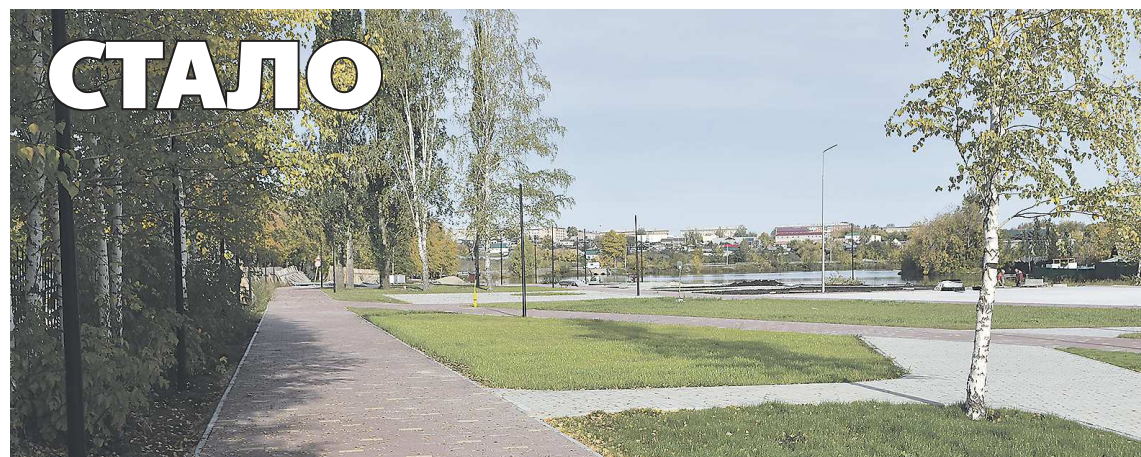
ПРЕДСТАВЛЕНО РЕДАКЦИЕЙ ГАЗЕТЫ «РЕЖЕВСКАЯ ВЕСТЬ»