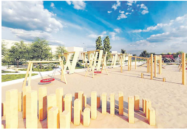
Детская игровая зона в парке «Талицкий»

В прошлом году в голосовании по благоустройству терри-