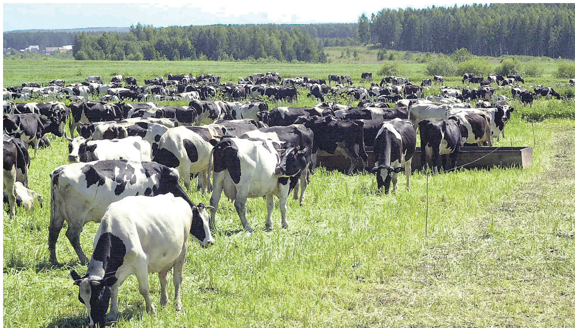
Белоярские животноводы – рекордсмены по сбору молока

В хозяйствах Белоярского городского округа выращивают в основном голштинскую и черно-пеструю породы коров. Но в