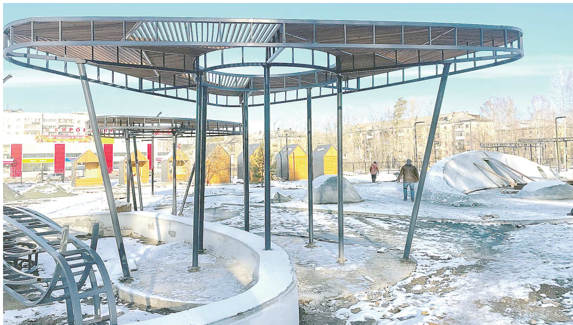
Благоустройство парка «Огненная саламандра» началось в прошлом году благодаря победе во Всероссийском конкурсе лучших проектов создания комфортной городской среды

В рамках работ на объекте появится фотозона, куда смогут приходить молодожены, поскольку аллея примыкает к городскому запусу. Ранее подобных мест в городе никогда не было. Также планируется обустроить детскую игровую площадку, а также входную группу с подсветкой.