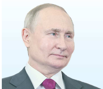
Владимир ПУТИН, Президент России

“Муниципальные власти, безусловно, должны находиться с жителями в постоянном контакте, внимательно слушать и слышать их запросы и чаяния, быстро реагировать на эти запросы. Опыт показывает, что цифровизация повышает уровень качества и действенности такой обратной связи... Но подчеркну, что цифровизация сама по себе не заменит никаких личных контактов и встреч с людьми. Регулярное общение с ними – важнейший фактор повышения взаимопонимания и доверия между гражданами и местной властью.