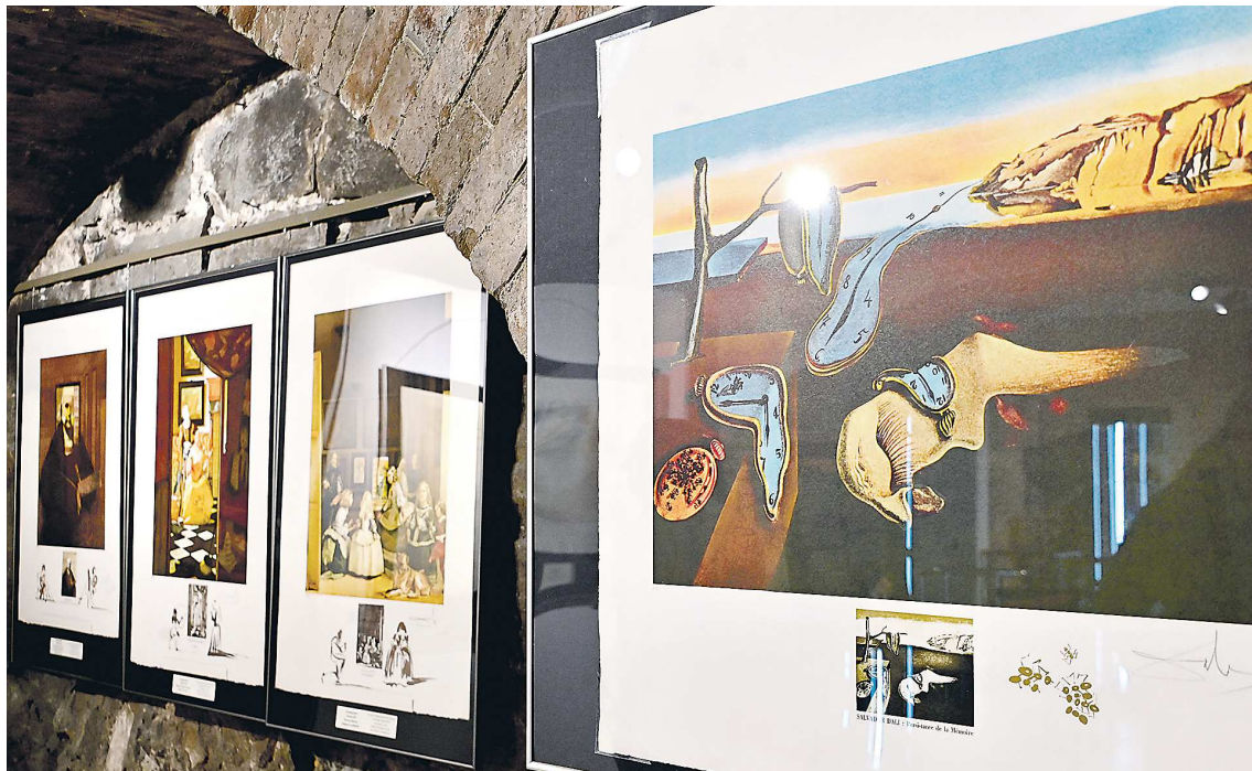
Художник «далинизировал» даже собственные сюжеты. Справа – авторский вариант знаменитой картины Дали «Утекающее время». Посмотрите: в сравнении с оригиналом циферблатов здесь больше...

В Екатеринбурге – выставка с заманчивыми рецептами от художника-гения