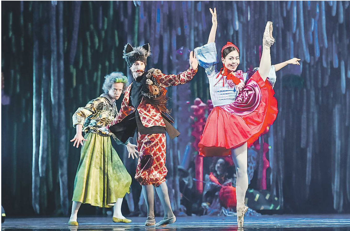
Персонажи те же, то у Шарля Перро, но характеры Бабушки, Волка и Красной Шапочки – не узнаешь...