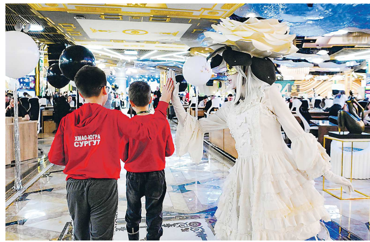
Участников турнира встречали аниматоры