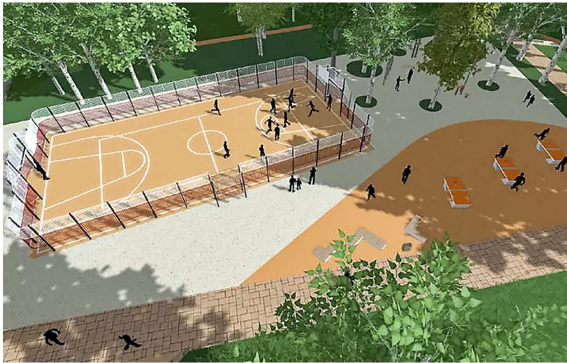
За дизайн-проект обновленного парка 50-летия ВЛКСМ проголосовали более 26 тысяч жителей Екатеринбурга

В Екатеринбурге в этом году на выбор жителям представлены восемь общественных