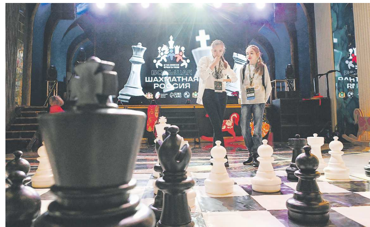
Большие шахматы вызвали у гостей особый интерес

Соревнования по классическим шахматам продолжатся до 15 апреля. 15 апреля состоится награждение победителей и призеров во всех возрастных категориях, а также торжественная церемония закрытия турнира. Соревнования будут проходить в Общественном центре УрФУ в Новокольцовском.