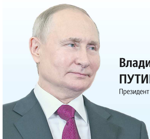
Владимир ПУТИН, Президент России

“ В семье укоренены наша культура, идентичность, национальный характер. Семья учит, воспитывает, передает традиции, знания, в том числе и профессиональный опыт.