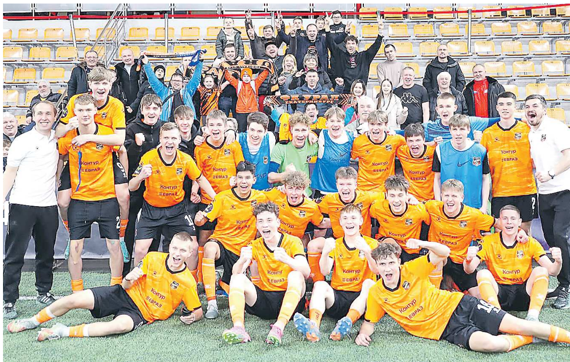
«Урал-2007» и его победные эмоции после победы над «Зенитом»

ЮФЛ – первенство среди академий профессиональных футбольных клубов. Лига была создана в сезоне 2019/2020 и имеет деление внутри организации. Есть федеральная лига, в которой выступают ведущие команды страны, а есть региональные лиги, в которых выступали клубы из регионов и были разбиты на группы по территориальной расположенности: Урал – Западная Сибирь, Приволжье и другие. Екатеринбургский «Урал» первые два сезона провел в региональных лигах. Сначала «Урал-2007» стал победителем зоны Урал – Западная Сибирь, а на следующий сезон «Урал-2007»