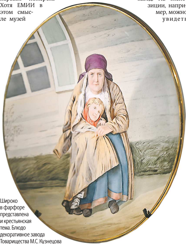
Широко в фарфоре представлена и крестьянская тема. Блюдо декоративное завода Товарищества М.С. Кузнецова