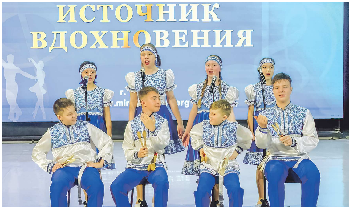
Ансамбль Детской школы искусств «Верх-Нейвинские ложкари» является неоднократным победителем международных, всероссийских и областных конкурсов

– С каждым годом интерес к конкурсу растет. Если в первый раз за весь список шорт-листа было отдано чуть больше 50 тысяч голосов, то во второй – почти 67 тысяч. Хочу напомнить, что здесь нет проигравших: все номинанты – это наше достояние, каждый заявившийся – уже побе-