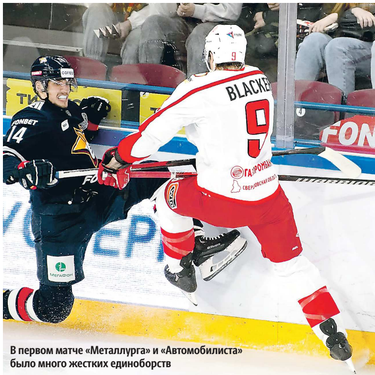
В первом матче «Металлурга» и «Автомобилиста» было много жестких единоборств