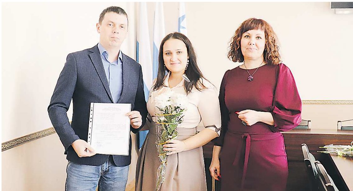
ПРЕСС-СЛУЖБА АДМИНИСТРАЦИИ СЕВЕРОУРАЛЬСКОГО ГОРОДСКОГО ОКРУГА