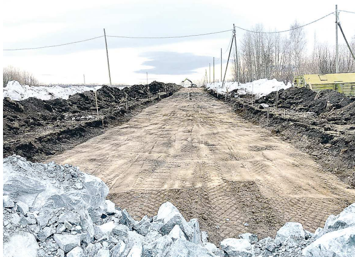
ПРЕСС-СЛУЖБА АДМИНИСТРАЦИИ СЕВЕРОУРАЛЬСКОГО ГОРОДСКОГО ОКРУГА

На текущий год планируется возведение дорог на улицах Родниковой и Ясной, общей протяженностью 1,8 км и шириной шесть метров.