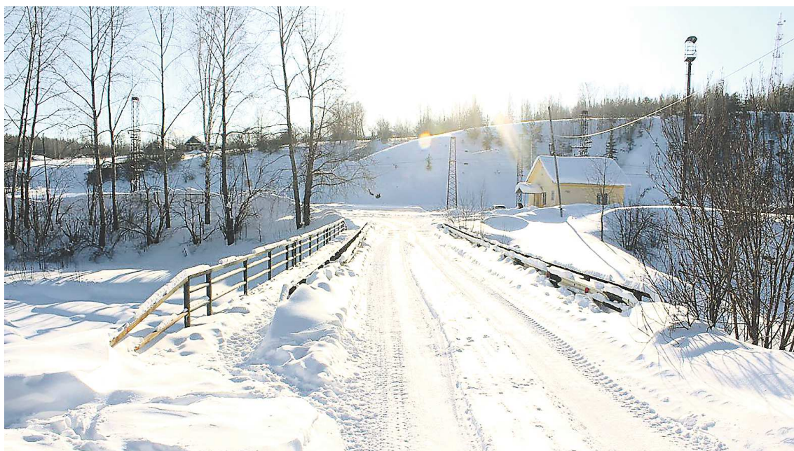
Обновление моста входит в комплекс мероприятий по обеспечению проезда к территории карпинского железнодорожного вокзала

– Мост сейчас находится в неудовлетворительном состоянии и нуждается в обновлении. Кроме того, администрация заключила договоренность с РЖД, по которой они запустили в город маршрут «Ласточка». Компания также взяла на себя обязательства отремонтировать здание самого железнодорожного вокзала и прилегающую территорию. А мы, в свою очередь, должны отремонтировать улицу Рачева, оборудовать пешеходную зону, освещение и при-