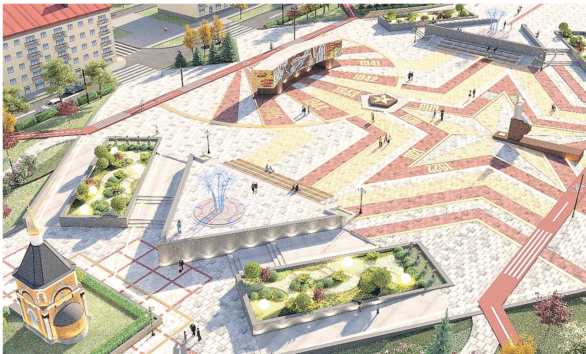
ИЗ ПРОЕКТНОЙ ДОКУМЕНТАЦИИ