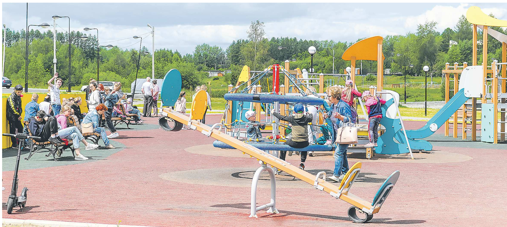
Комитет контролирует реализацию проекта «Формирование комфортной городской среды» в Свердловской области

Очень важно отметить, что сохраняется преемственность. Многие депутаты избираются повторно – это важный показатель доверия избирателей, который, безусловно, оказывает положительное влияние на нашу работу.