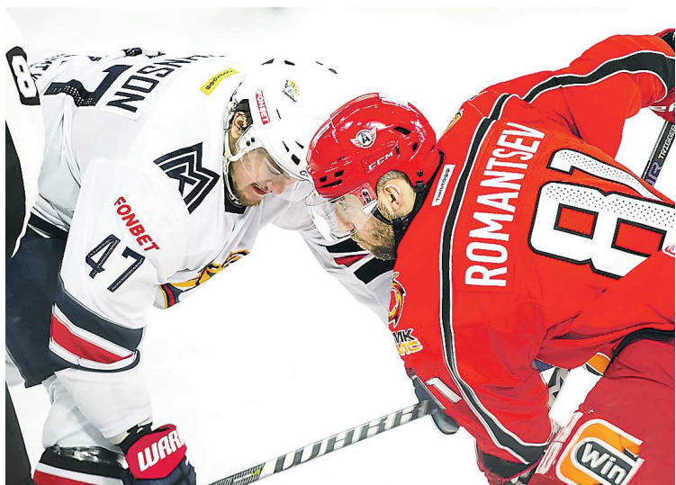
Противостояние «Автомобилиста» и «Металлурга» обещает быть жарким

«Автомобилист» и «Металлург» встречаются между собой в плей-офф в четвертый раз в истории. До этого победу в серии трижды одерживали именно магнитогорцы. Самым обидным для екатеринбуржцев было прошлогоднее поражение в первом раунде. «Шоферы» вели в серии со счетом 3:2, а в решающей, седьмой игре выигрывали со счетом 3:1 за шесть минут до конца матча. Всего шесть минут оставалось до выхода в следующий раунд, но «Металлург» сравнял счет, а затем вырвал победу в овертайме, отправив «Автомобилист» в отпуск. Конечно, такое поражение