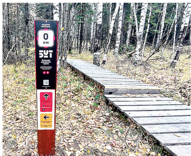
Нулевой километр БУТ

Для путешествий по Свердловской области команда БУТ разработала 30 походов выходного дня (ПВД) протяженностью от 5 до 65 км. Для удобства туристов БУТ промаркирована бело-красно-белыми метками. Проект поддерживают департамент по развитию туризма и индустрии гостеприимства Свердловской области и благотворительный фонд «Синара».