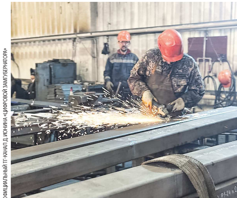
Предприятие в Михайловске изготовило опоры и балки для крупнейшего индустриально-промышленного парка на Дальнем Востоке «Авиаполис Янковский» и ряда других объектов

Компания «МеталлСтройИнжиниринг» занимается изготовлением металлоконструкций на разных площадках уже 10 лет. За это время она реализовала более 430 проектов в России и странах ближнего зарубежья. Металлоконструкции уральского завода используют при строительстве торговых центров, производств, спортивных центров и складов, объектов нефтегазовой, горнодобывающей и теплоэнергетической отраслей. В планах построить еще минимум два предприятия и войти в топ-5 производителей металлоконструкций в стране.