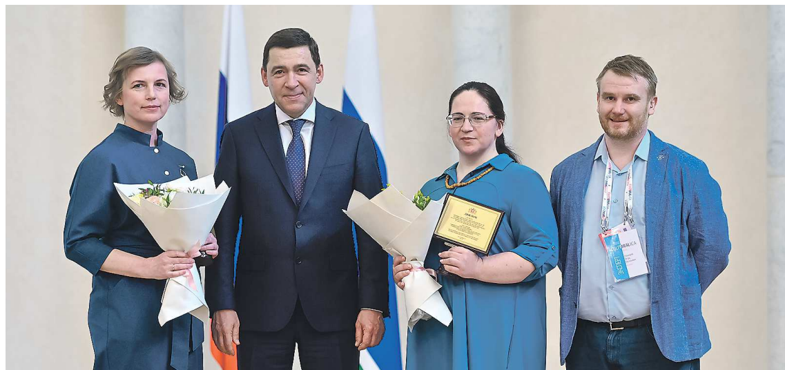
Премией губернатора Евгений Куйвашев наградил авторский коллектив Музея истории Екатеринбурга за городской проект для школьников «Екатеринбурговедение»