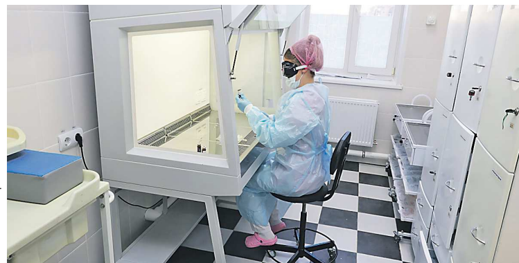
Одним из главных помещений обновленного центра является процедурный кабинет, где подготавливают необходимую для пациентов дозу химиотерапии