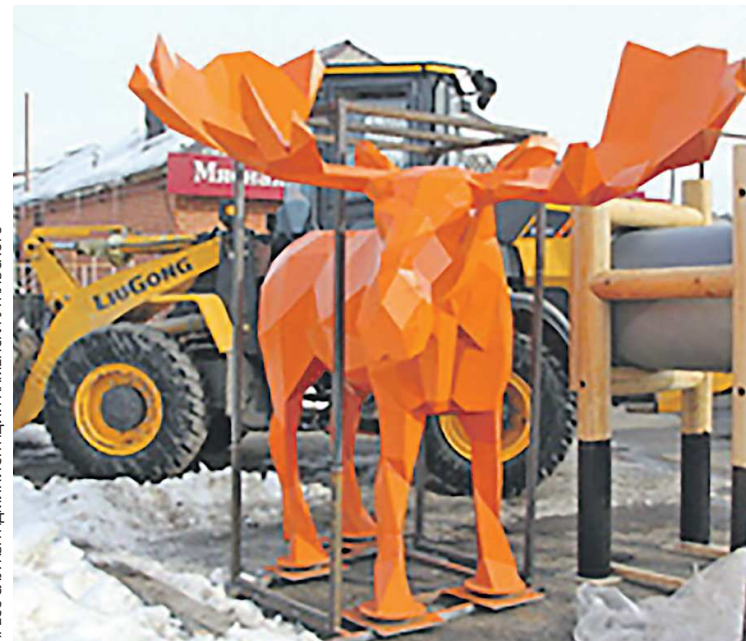
ПРЕСС-СЛУЖБА АДМИНИСТРАЦИИ КАМЕНСКА-УРАЛЬСКОГО

В текущем году благоустройство продолжается в рамках реализации программы «Формирование комфортной городской среды» национального проекта «Жилье и городская среда» благодаря победе в рейтинговом голосовании в 2023 году. Общая стоимость проекта составляет 312 миллионов рублей. В 2024 году работы планируется завершить до 30 сентября.