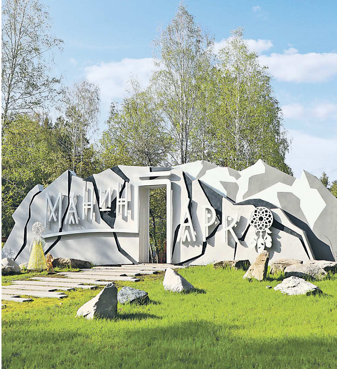
АДМИНИСТРАЦИЯ ГОРОДСКОГО ОКРУГА ВЕРХНЯЯ ПЫШМА