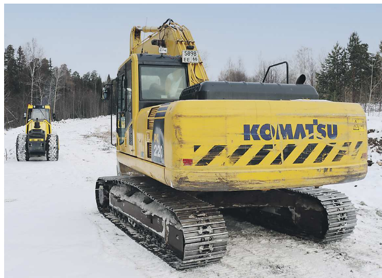
Дорожная техника уже вышла на объект