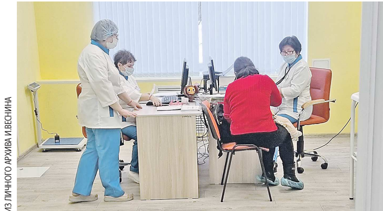
Первых пациентов в поликлинике начали принимать еще в конце февраля

В Верхней Туре состоялось долгожданное открытие нового детского поликлинического отделения ЦГБ после капитального ремонта. Работы удалось провести за год. Просторные и светлые коридоры, комфортные условия для ожидания приема — все это стало возможным благодаря действующему национальному проекту «Здравоохранение». Стоимость работ составила порядка 6,7 млн рублей.