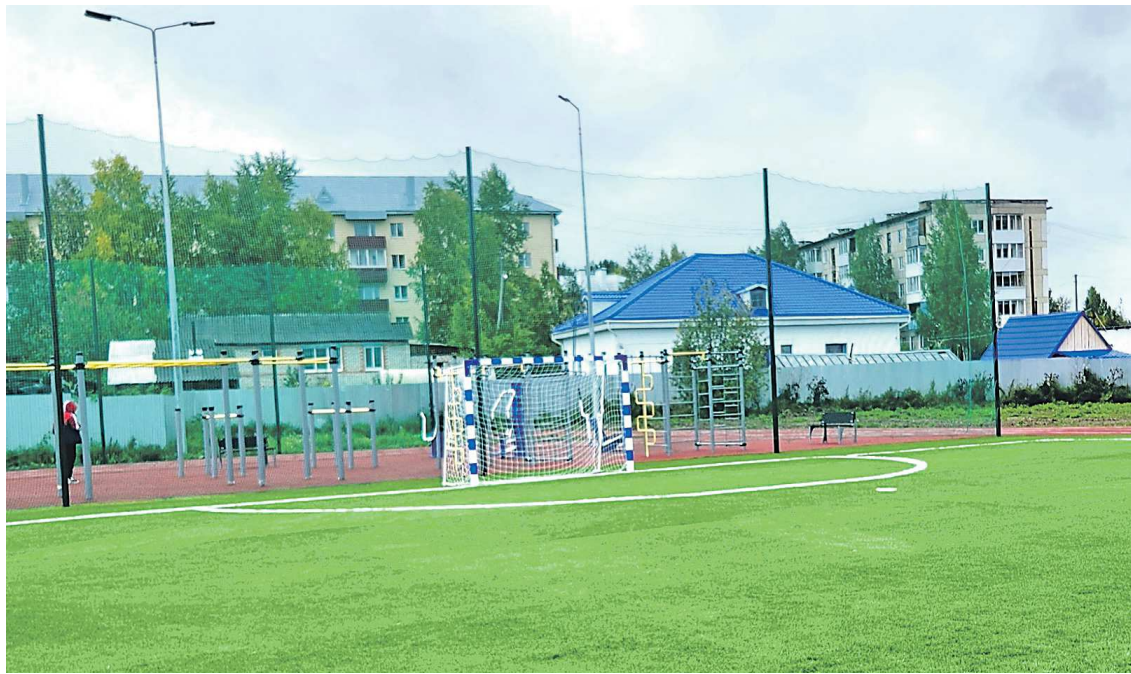
В прошлом году в муниципалитете уже открыли новый стадион у школы №2 в микрорайоне Ивдель-4, в этом году работами займется тот же подрядчик

Для реализации проекта Ивдельскому городскому округу увеличили расходные полномочия. Сумма контракта составила порядка 33 млн рублей. По плану подрядчик может выполнять работы в течение двух лет, однако планируется завершить работы в текущем году.