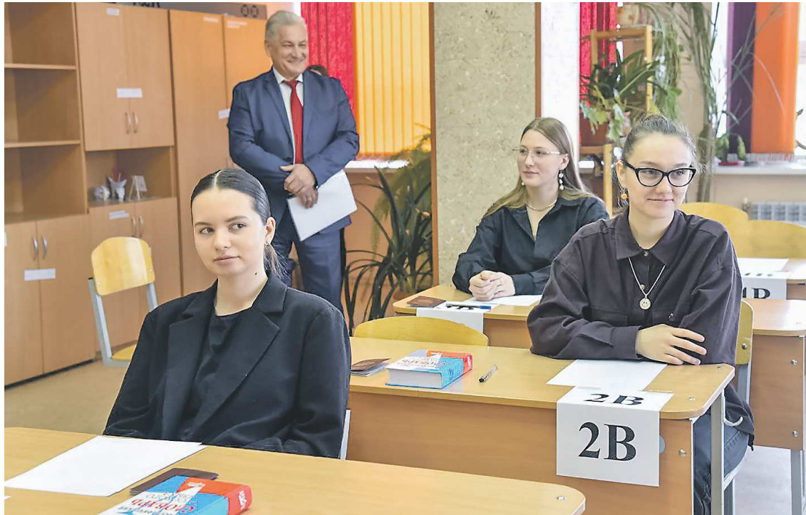
Организацию досрочного прохождения ЕГЭ лично проконтролировал министр образования и молодежной политики региона Юрий Биктуганов

– Я закончила девять классов, сейчас обучаюсь в музыкальном училище имени Чайковского, на вокальном отделении, и так как у нас будет госэкзамен в конце