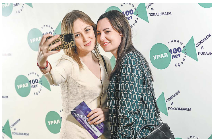
Свердловский фильмофонд ожидает на своих мероприятиях за этот год не менее 50 тысяч зрителей

Что касается появления именно государственного кинопроката, тут фигурирует другая дата: 1924 год, было создано «Совкино», а чуть позже – региональное отделение «Уралсовкино». Именно благодаря этой организации