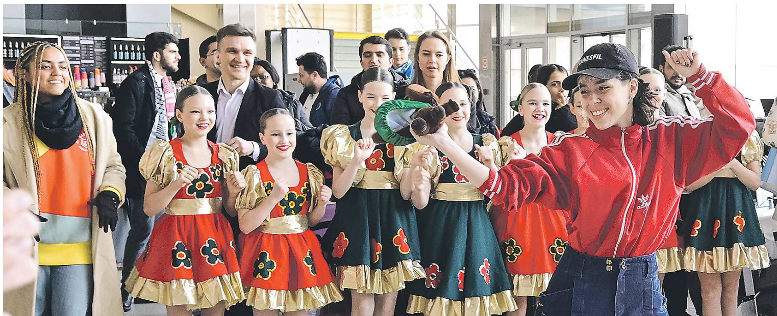
Чистая импровизация – танцевальный баттл иностранных участников ВФМ и свердловских артистов в аэропорту Кольцово

За несколько минут до церемонии привезли иностранные делегации. Многие из гостей несли в руках флаги своих государств, некоторые даже облачились в национальные костюмы – появилось ощущение настоящего праздника. Участники из России и других стран обнимались, увлеченно общались – многие в Сочи успели подружиться, а региональный этап фестиваля дал шанс на еще одну встречу.