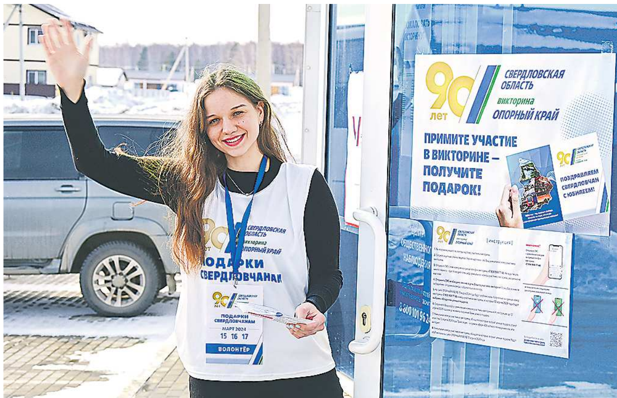
Не заметить пункт проведения викторины практически невозможно

Напомним, что викторина «ОПОРНЫЙ КРАЙ» пройдет в Свердловской области 15, 16, 17 и 18 марта. Более 2 000 пунктов проведения викторины будут работать во всех населенных пунктах Свердловской области рядом с помещениями избирательных участков. График работы пунктов: с 8 до 20 часов.