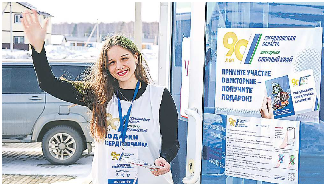
Не заметить пункт проведения викторины практически невозможно