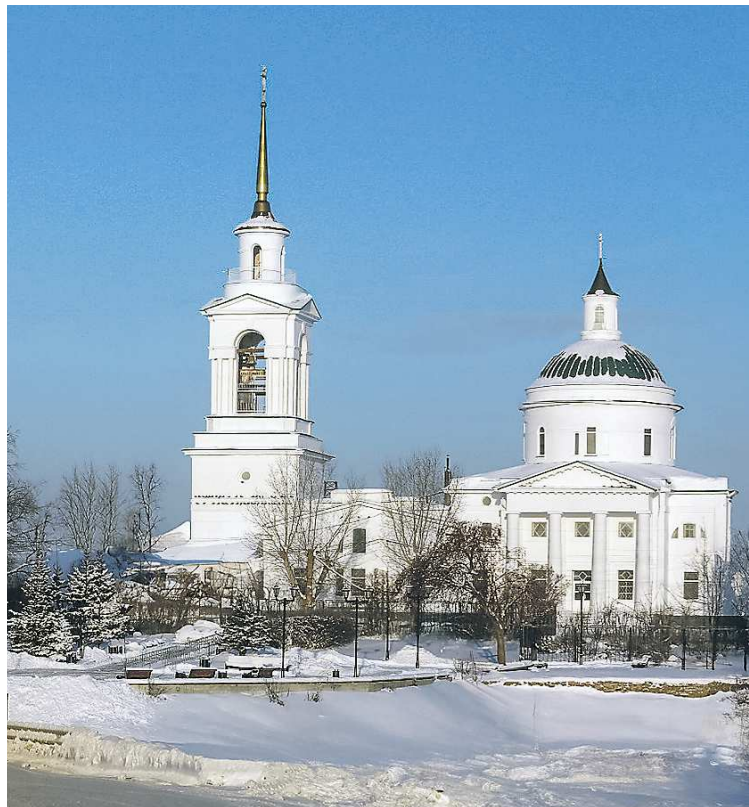
Храм во имя Святой Троицы

Отметим, что в 2023 году муниципалитет получил субсидию департамента по развитию туризма и индустрии гостеприимства Свердловской области, установили знаки туристской навигации. В Арамилском городском округе очень активное предпринимательское сообщество – объем привлеченных средств в развитие инфраструктуры (государственные субсидии и частные инвестиции) превысил 130 млн, по привлеченным средствам среди муниципалитетов южного управленческого округа по национальному проекту «Туризм и индустрия гостеприимства» Арамилль занимает второе место.