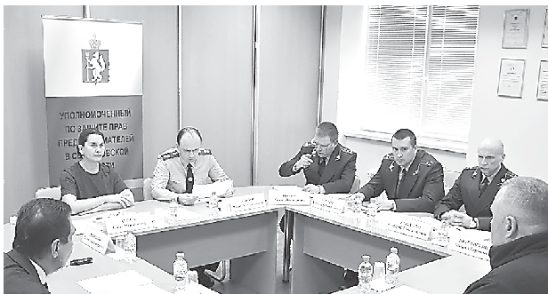
Прием с прокурором Свердловской области (30 марта, г. Екатеринбург)