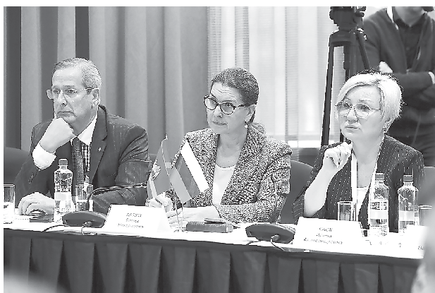
Секция федерального проекта «Предпринимательство» партии «Единая Россия» в рамках Русского экономического форума (10 ноября, г. Челябинск)