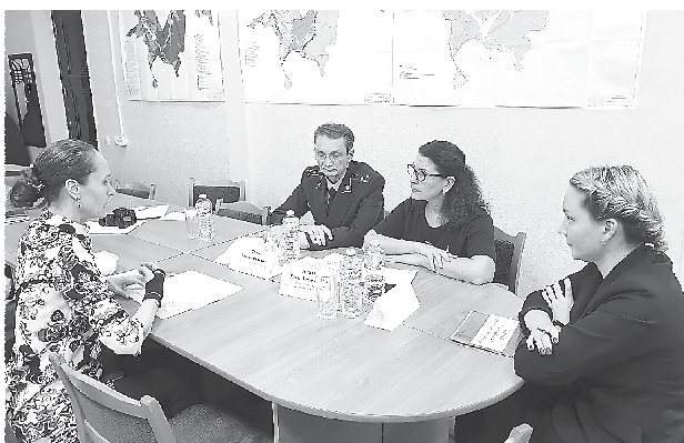
Прием с Главой Арамилского городского округа и Сысертским межрайонным прокурором (10 марта, г. Арамиль)