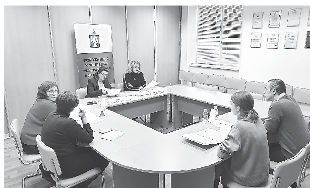
Прием с Департаментом государственного жилищного и строительного надзора Свердловской области (6 декабря, г. Екатеринбург)