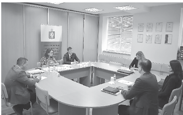
Прием с ГУ МВД России по Свердловской области (19 апреля, г. Екатеринбург)