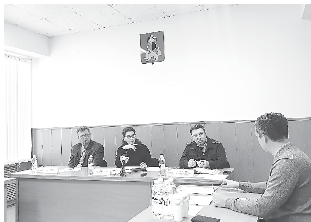
Прием с прокурором г. Первоуральска и Администрацией городского округа Первоуральск (27 октября, г. Первоуральск)