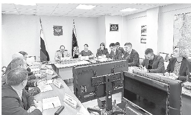
Общественный совет при прокуратуре Свердловской области по защите малого и среднего бизнеса (26 декабря, г. Екатеринбург)