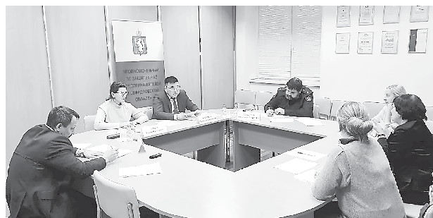
Прием с и.о. руководителя следственного управления Следственного комитета России по Свердловской области (29 ноября, г. Екатеринбург)