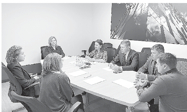
Прием с Администрацией города Нижний Тагил (13 февраля, г. Нижний Тагил)