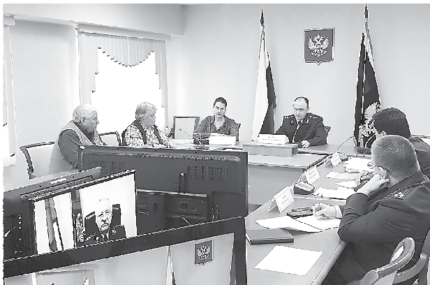
Прием с прокурором Свердловской области (22 марта, г. Екатеринбург)