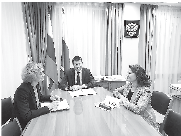
Рабочая встреча с Министром экономики и территориального развития Свердловской области (8 декабря, г. Екатеринбург)