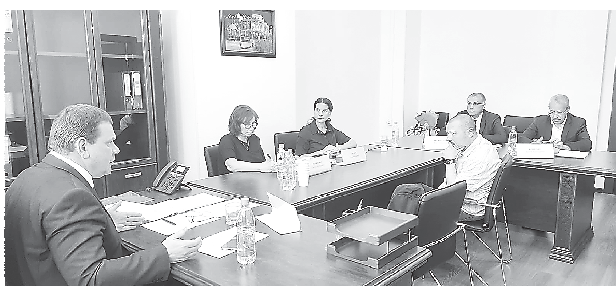
Прием с Администрацией города Екатеринбурга (24 мая, г. Екатеринбург)