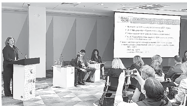
Панельная дискуссия «Контрольная (надзорная) деятельность как инструмент снижения социально-значимых рисков и издержек бизнеса» в рамках VII Общероссийского форума стратегического развития «Города России: новые рубежи» (16 ноября, г. Екатеринбург)