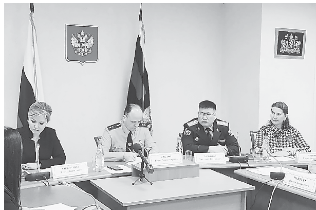
Прием с прокурором Свердловской области, и.о. руководителя следственного управления Следственного комитета России по Свердловской области и генеральным директором АНО «Платформа для работы с обращениями предпринимателей» (9 ноября, г. Екатеринбург)