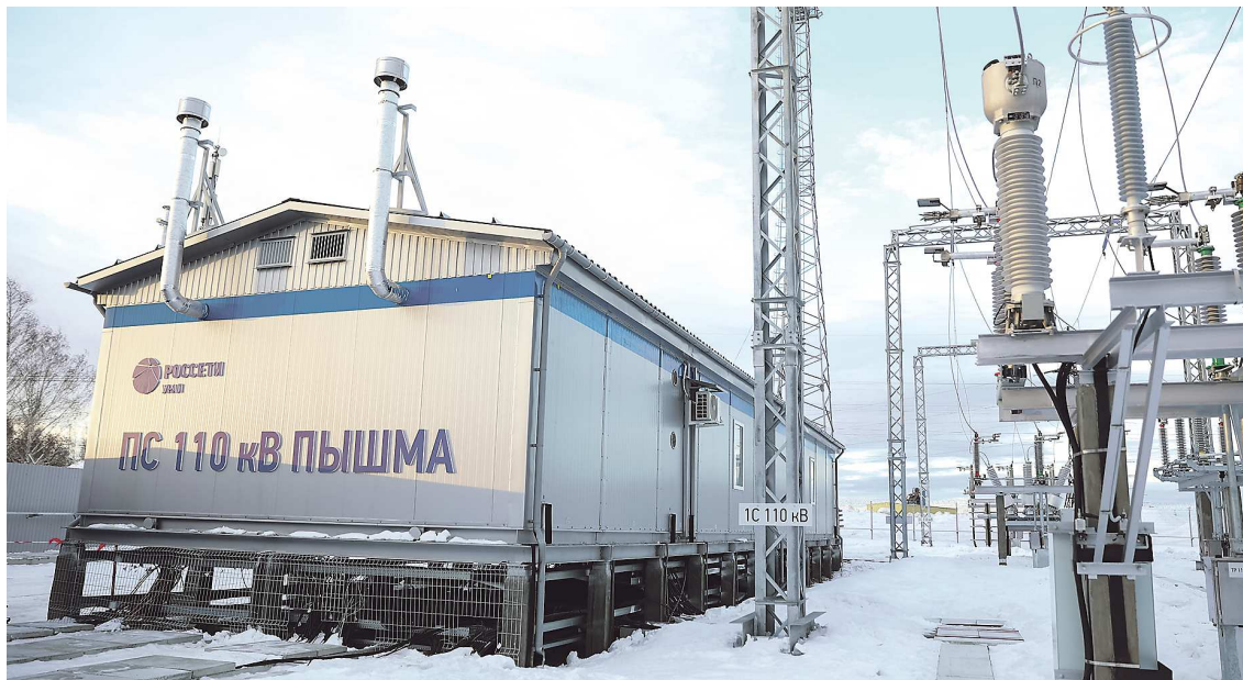
В ходе реконструкции подстанции использовалось исключительно отечественное оборудование и технологии