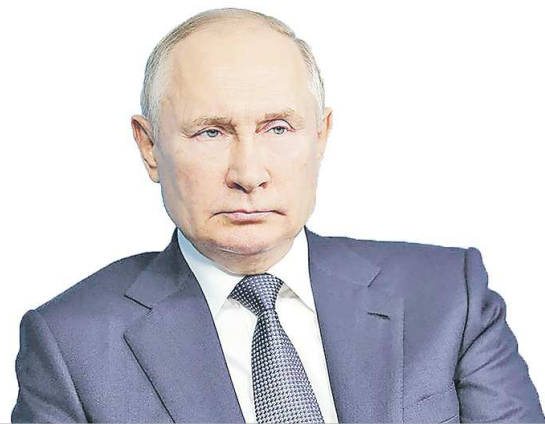
Владимир ПУТИН, Президент России

“ Регулярное общение с людьми – важнейший фактор повышения взаимопонимания и доверия между гражданами и местной властью. Очень важно непосредственное участие жителей в принятии решений.