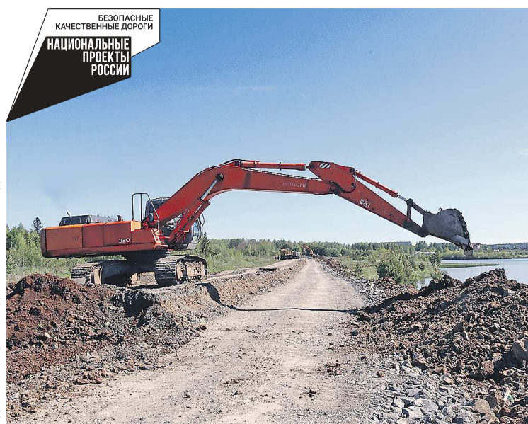
Ремонтные работы по улице Туринской ведутся с 2022 года