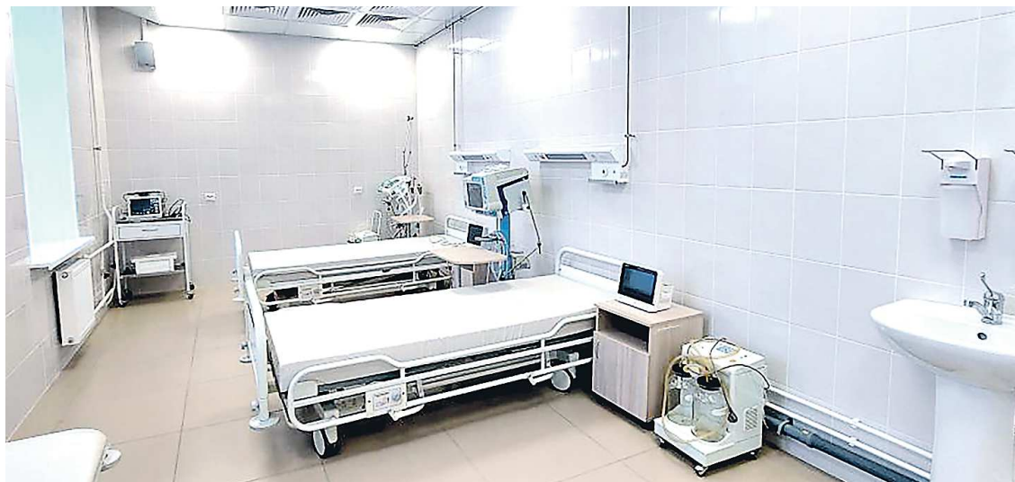
Так выглядят палаты нового гериатрического отделения

Специалисты отделения будут помогать уральцам старше 60 лет сохранять или восстанавливать способность к самообслуживанию, физической и функциональной активности. Забота об активном долголетии уральцев, сохранении их здоровья для максимально полноценной жизни является приоритетом медиков. Реализовывать эти задачи помогает региональная программа «Старшее поколение»