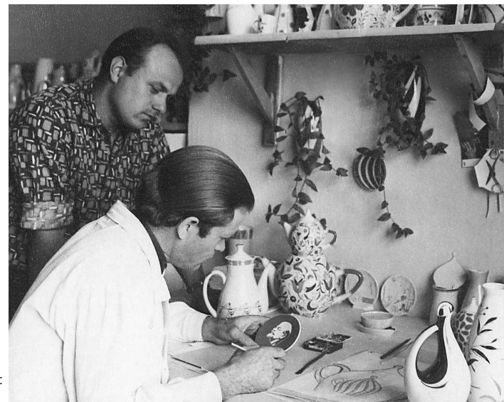
ПРЕДСТАВЛЕНО МУЗЕЕМ ИСТОРИИ ЕКАТЕРИНБУРГА