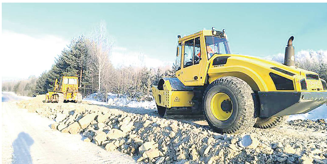
На объект в Сосьвинском городском округе уже вышла дорожная техника

Как сообщили в Управлении автомобильных дорог Свердловской области, целый ряд работ по технологии можно выполнять даже при отрицатель-