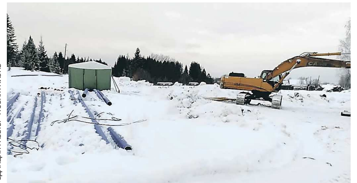
Работы на объекте ведутся второй год