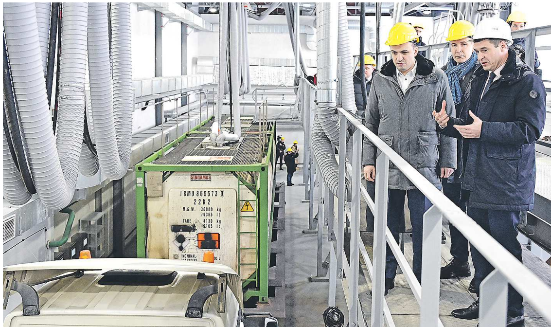
Заместитель губернатора Дмитрий Ионин (слева) и министр инвестиций и развития региона Вадим Третьяков (в центре) осматривают обновленную мойку цистерн для химической промышленности компании «Уралхимпласт» – Хюттенес Альбертус

Крупный инвестиционный проект на территории «Химпарк