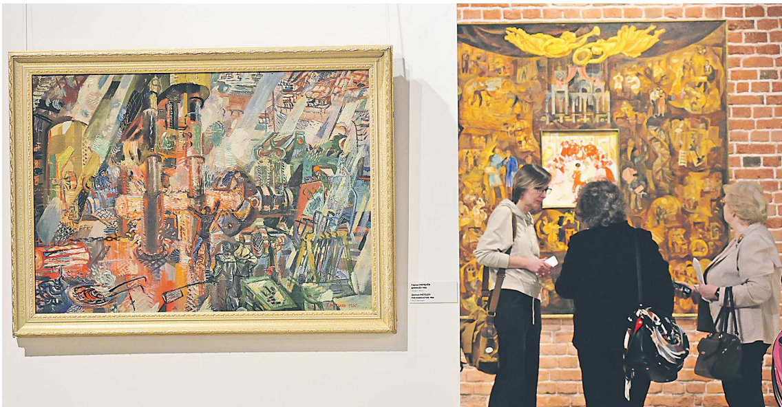
Зрители надолго останавливаются у картин о буднях и апофеозе Творчества – «Дирижер» (слева) и «Театр»