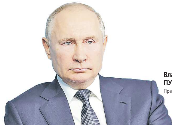
Владимир ПУТИН, Президент России

« Впервые стартовав в 1982 году, за прошедшее время турнир вырос в масштабный спортивный праздник, который широко отмечается во многих регионах нашей страны. Объединяя представителей разных возрастов и поколений, целые семьи, он по праву считается одним из самых успешных проектов в сфере массового физкультурного движения.