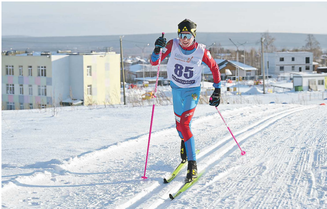
Спортсмены преодолевали дистанцию классическим ходом