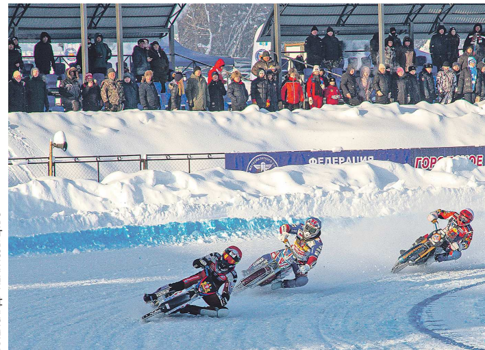
За яркими заездами ледовых гладиаторов наблюдали сотни каменских болельщиков

Традиционно в новогодние праздники каменск-уральский стадион «Металлург» становится местом притяжения сильнейших мотогонщиков на льду. В этом году 6 и 7 января в Каменске-Уральском состоялся второй этап личного чемпионата России по спидвею.