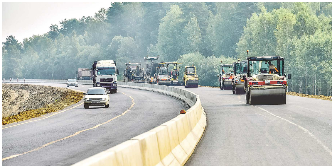
Свердловская область готова включиться в реализацию нового нацпроекта «Инфраструктура для жизни» в 2025 году

В рамках проекта «Чистая вода», входящего в нацпроект «Жилье и городская среда», проведена реконструкция системы водо-