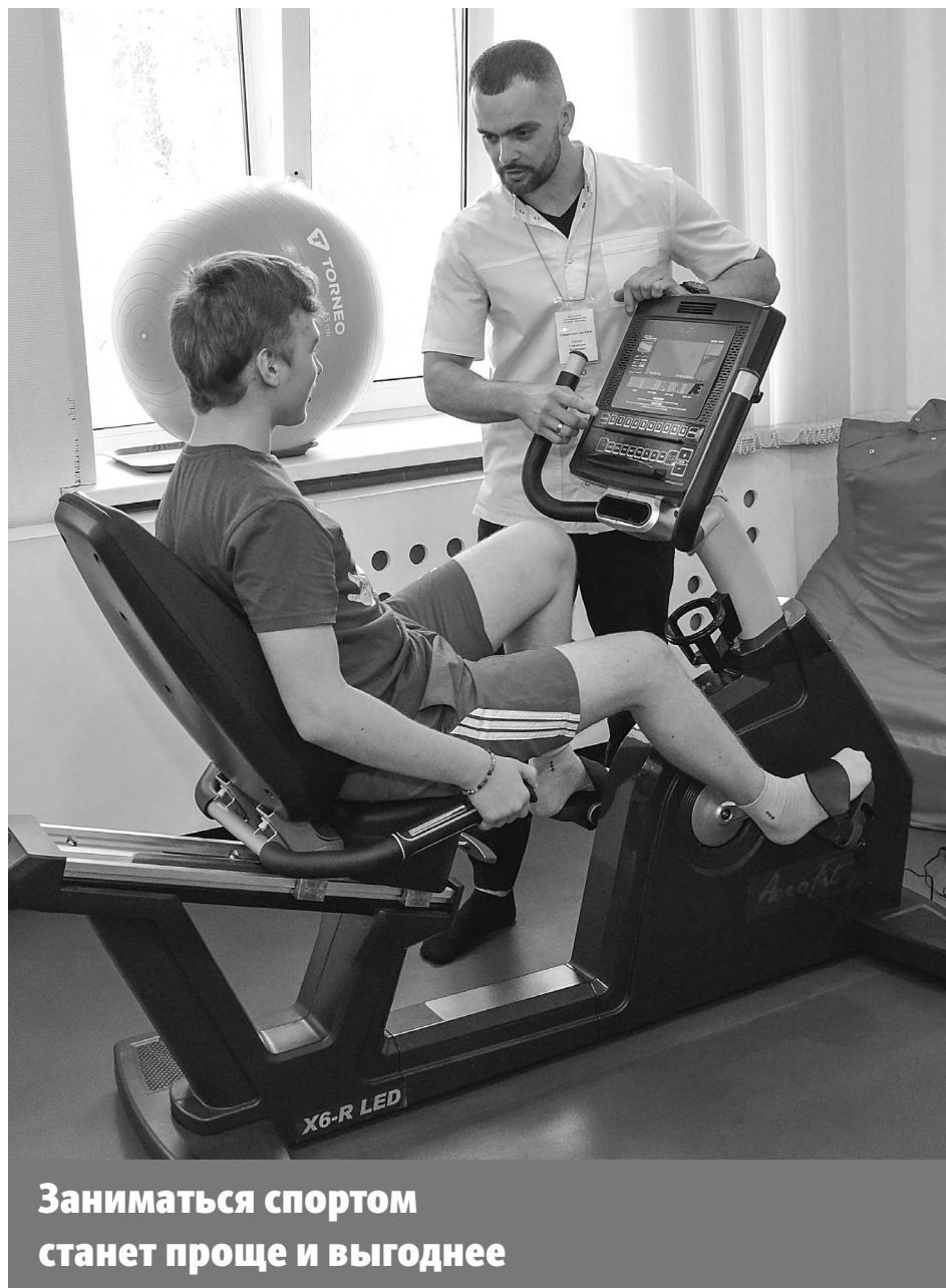
Заниматься спортом станет проще и выгоднее

Эксперты УрГЮУ о налоговых вычетах, госпрограммах и социальных доплатах к пенсии