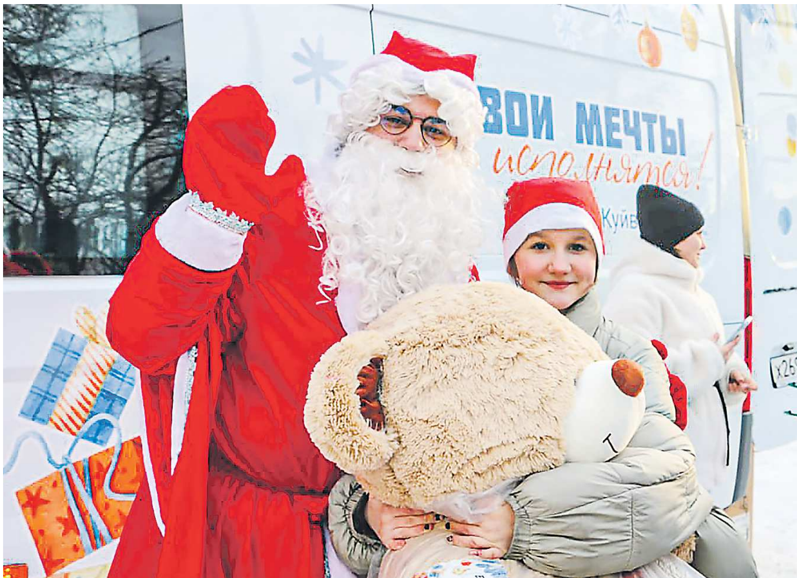
Акция «Новогодний грузовичок» проходит в Свердловской области второй год