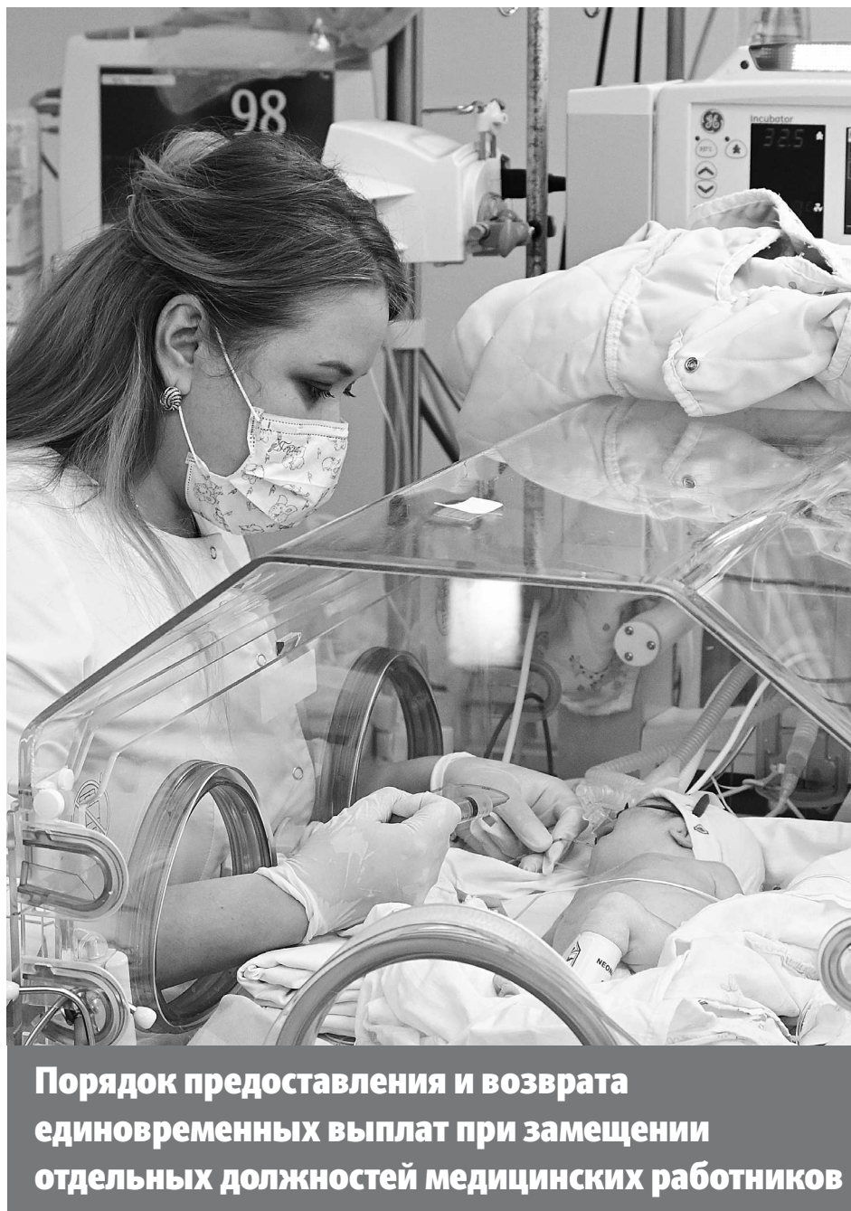
Порядок предоставления и возврата единовременных выплат при замещении отдельных должностей медицинских работников

Таким образом, для получения вычета в размере 13% от стоимости спортивных занятий с 1 января не нужно самостоятельно оформлять документы, но придется уточнить, входит ли спортивная организация в перечень, утвержденный Министерством спорта России, и если эта организация состоит в нем, предоставить ей сведения о некоторых своих документах.