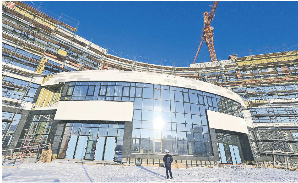
Так сейчас выглядит будущий корпус СУНЦа

– Новый центр позволит расширить количество обучающихся, замкнуть их в такую систему, где они живут и учатся одно-