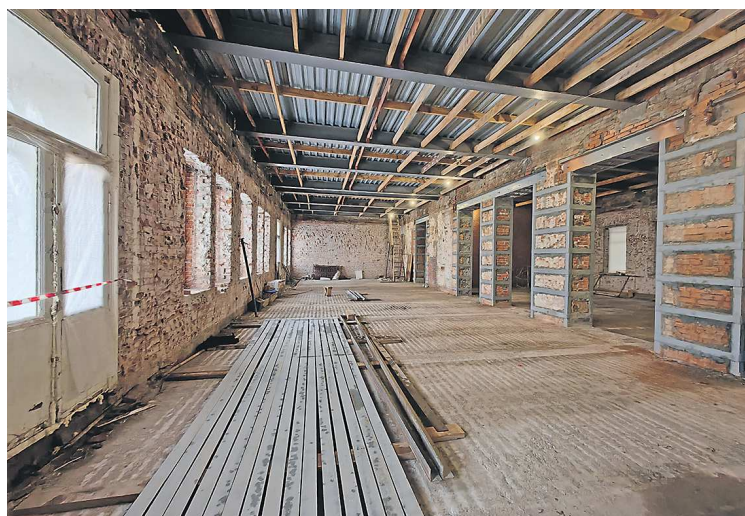
Через год здесь будут располагаться учебные классы Академии

Сейчас в «Доходном доме» вовсю кипят строительные работы. В первую очередь они направлены на укрепление фундамента и стен здания. Экскур-