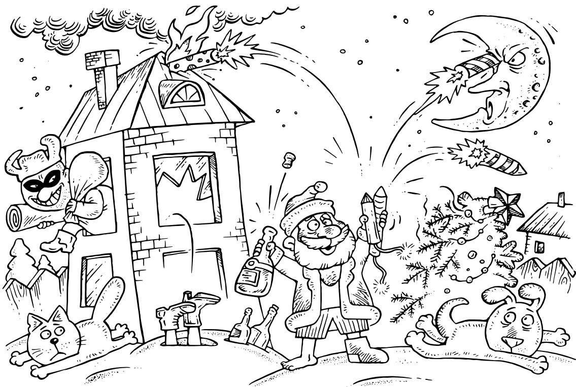
РИСУНОК МАКСИМА СМАГИНА