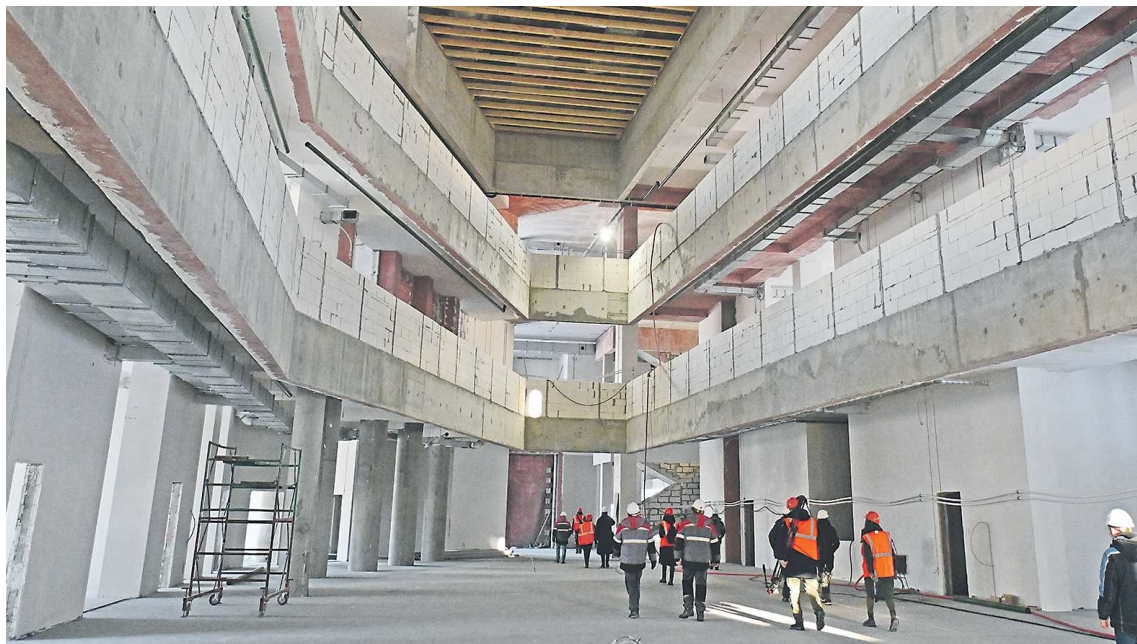
В каждом корпусе второй очереди кампуса есть атриумы, где появятся коворкинги для отдыха и учебы студентов