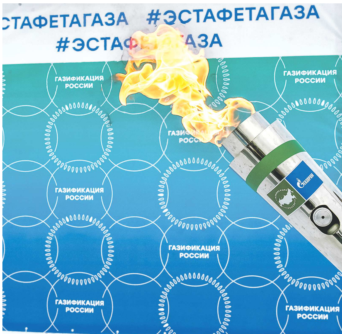
Программа развития газоснабжения и газификации Свердловской области была утверждена в сентябре 2022 года для обеспечения развития промышленного потенциала Свердловской области и создания новых производственных мощностей