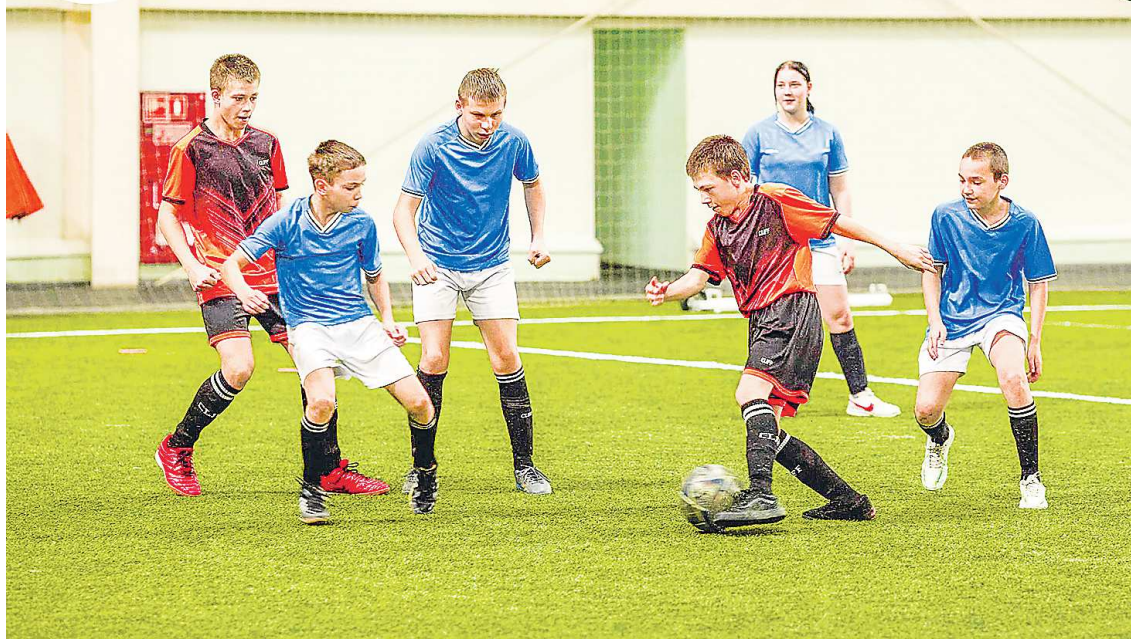
Матчи фестиваля получились яркими и зрелищными

Фестиваль включил в себя сразу несколько спортивных событий. Так, в рамках мероприятия состоялись матчи третьего тура Детской адаптивной футбольной лиги — уникального проекта, который объединя-