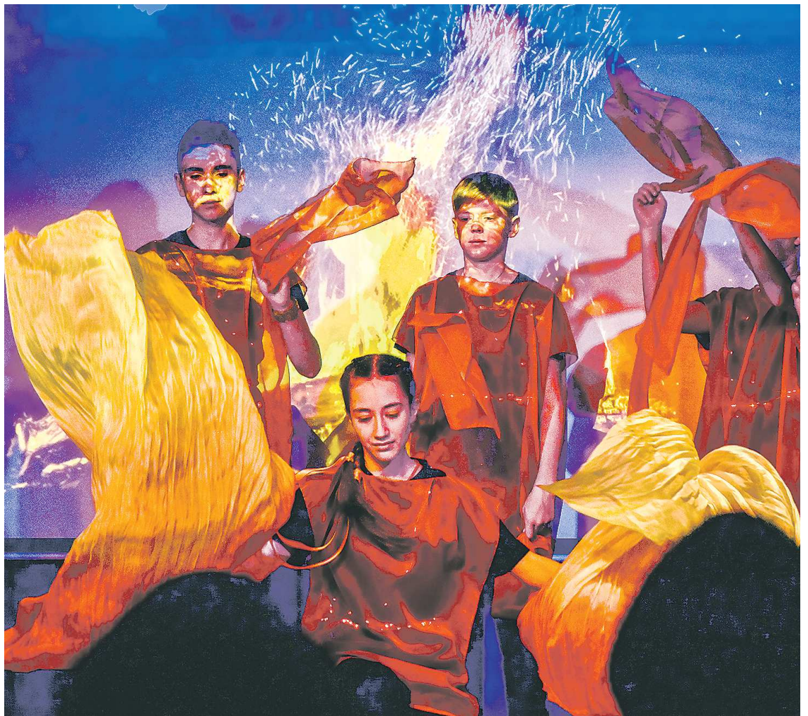
Сцена из новогоднего спектакля «Тайна Уральских гор»

Главный герой, начинающий камнерез Данилка Недокормыш, встретил свою любовь – милую Катю Летемину. Дело близилось к свадьбе, но молодой паре мешала лишь одна деталь – принципиальное желание Данилы найти каменный цветок (так он