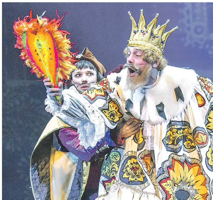
Царь Берендей с пером Жар-птицы, укравшей заветное яблочко

Сюжет спектакля «Иван-царевич и Серый волк» повествует о приключениях главного героя и его братьев в заповедном лесу. Посреди зимы в царстве Берендея случается невиданное чудо – на дереве выросло яблоко. Сторожить его остаются Иван, Епифан и Кузьма. Старший засыпает, средний своеобразно отвлекается на свои заботы, и только младший бережно исполняет наказ отца. Внезапно откуда ни возьмись появляется Жар-птица, которая по воле злой силы должна забрать яблоко... А братья отправятся его искать, встречая на пути болотных Кикимор, Серого Волка и Бабу Ягу. Сцены спектакля разворачиваются на фоне