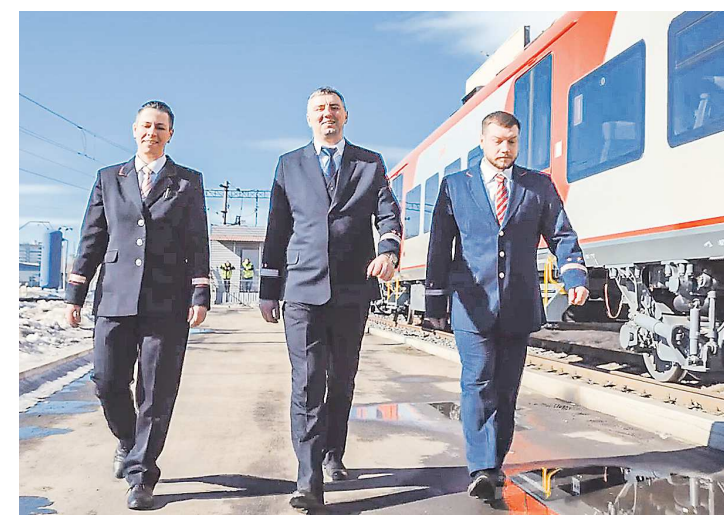
КАДР ИЗ ДОКУМЕНТАЛЬНОГО ФИЛЬМА