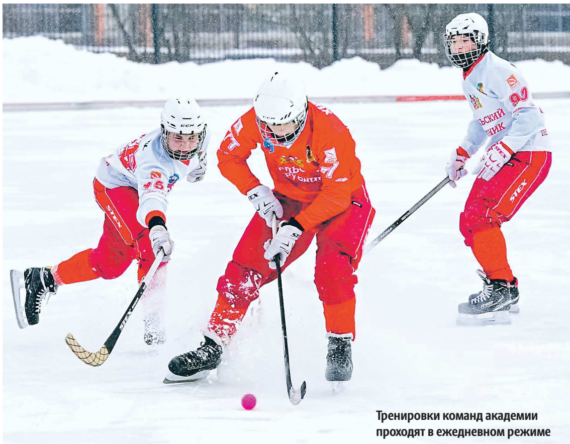
Тренировки команд академии проходят в ежедневном режиме

Академия хоккея с мячом «Уральский Трубник» отметила первый день рождения