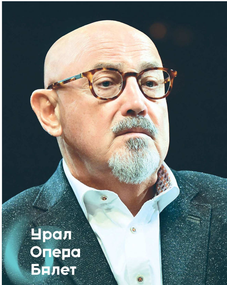
Урал Опера Балет

Годы спустя на сцене Екатеринбургского оперного состо-