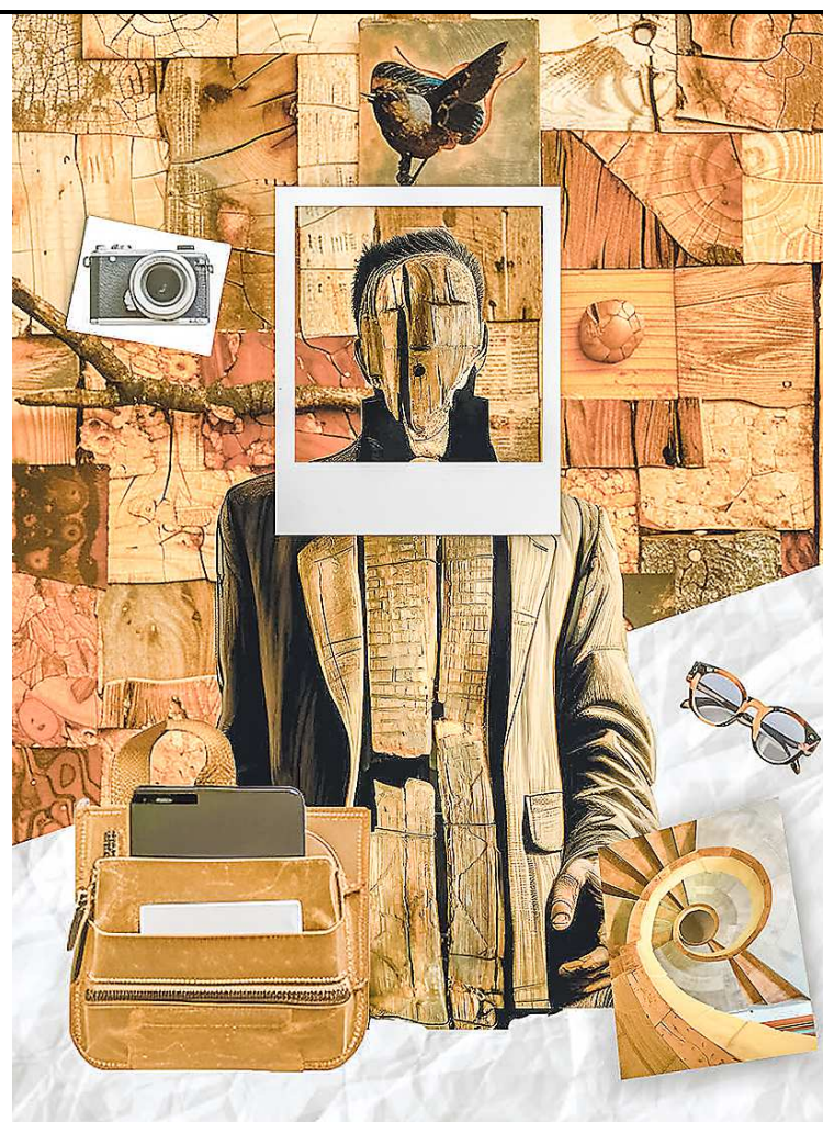
Обработанное нейросетью и художником изображение Шигирского идола