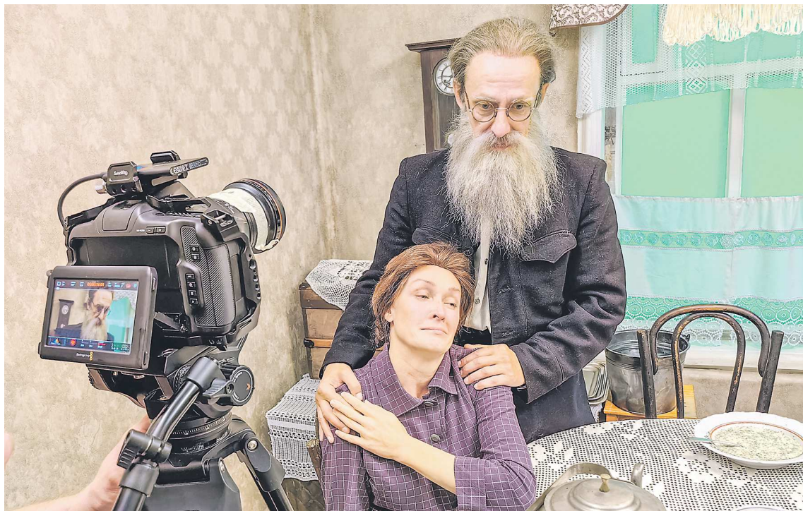
Съемки фильма «Бажов. Одолженное время»