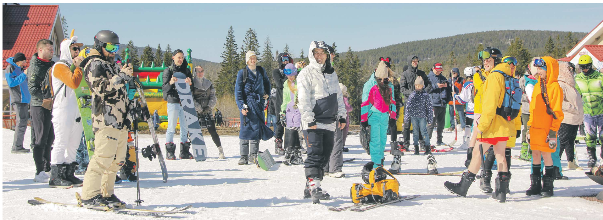
На базе управляющей компании ТРК «Гора Белая» по инициативе губернатора Евгения Куйвашева в регионе создана управляющая компания туристско-рекреационными кластерами Свердловской области. Ее миссия – создать новые возможности для полноценного отдыха, способствовать устойчивому развитию территорий через проектирование современной туристической инфраструктуры

С дома-музея писателя мы и начали знакомство с поселком. Построен дом в 1847 году. Именно здесь писатель провел свои детские и юношеские годы, о чем позднее с теплотой вспоминал в своих автобиографических записках. Музей, кстати, начался с небольшой комнаты в районной библиотеке, открытой в 1959 году. Ее называли народным музеем, экспонировались здесь в основном книги писателя, фотографии и несколько картин. И только в 1979 году открылся литературно-мемориальный музей – филиал Нижнетагильского музея-заповедника.