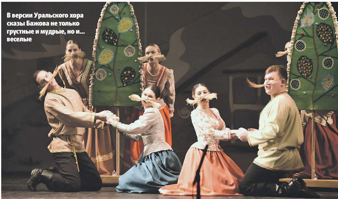
В версии Уральского хора сказы Бажова не только грустные и мудрые, но и... веселые