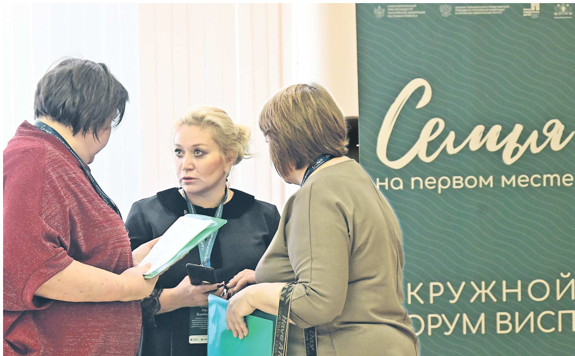
На форуме своим опытом поделились эксперты по социальной политике со всей страны

В течение всего дня представители органов государственной власти, НКО, общественных организаций представляли успешные практики, обсуждали роль органов опеки и попечительства в системе профилактики социального сиротства, развитие клубов для родителей и механизмы помощи родителям, воспитывающим детей с инвалидностью и ОВЗ.