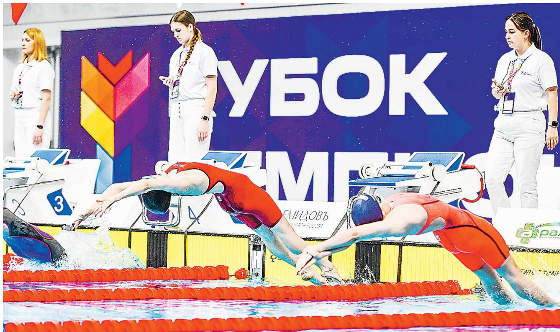
В каждом заплыве Кубка чемпионов была серьезная борьба за медали

Основные соревнования прошли в плавательном бассейне, где за медали турнира боролись около 600 спортсменов из 32 регионов страны. Как отметил четырехкратный олимпийский чемпион, основатель турнира Александр Попов, с каждым годом происходит прирост как по количеству участников, так и по их географии. При этом организаторы соревнований