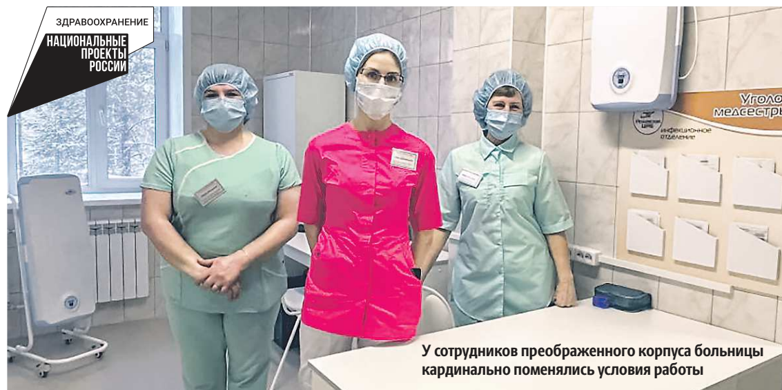
У сотрудников преобразенного корпуса больницы кардинально поменялись условия работы

В отремонтированном корпусе расположены сразу два отделения стационара больницы: на первом этаже — инфекционное, на втором — детское. Также в крыле здания работает противотуберкулезный кабинет, поэтому требования к разделению помещений, организации вентиляции