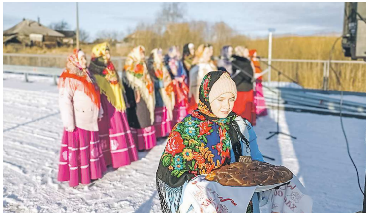
Открытие моста в деревне Ключевой стало праздником для местных жителей

– Ключевая делится рекой пополам, и жители отдаленной части деревни без этого моста не имели бы доступа к социально значимым объектам. Банально, до них бы не смогла добраться скорая, поэтому объект очень ва-