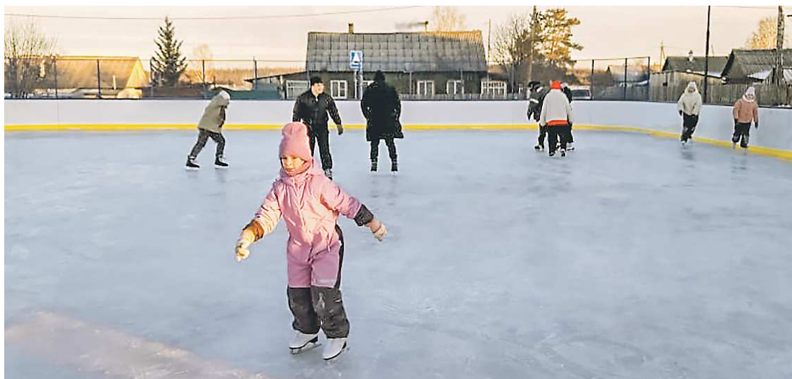
Новый корт в Озёрном уже пользуется популярностью у жителей