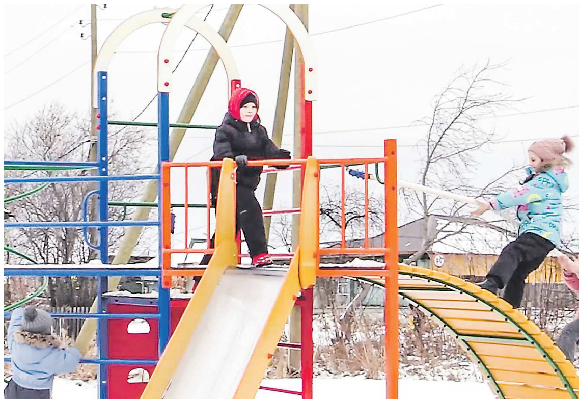
Детская спортивная площадка в Туринске в микрорайоне Слободка стала первым подобным объектом в этой части города