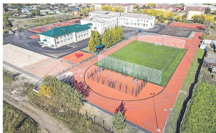
Новый стадион у школы № 50 стал самым крупным в Талицком городском округе

Стадион оборудован беговой дорожкой, площадкой для игр в стритбол, метания снарядов и стрельбы, двумя полосами препятствий, тремя площадками с тренажерами, скалодромом и ямой для прыжков в длину.