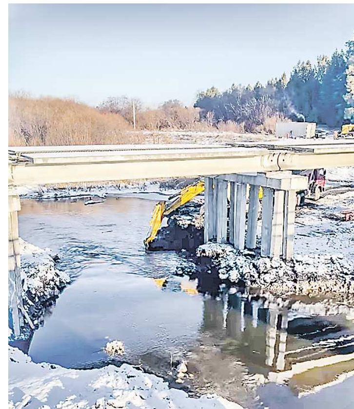
Один из крупнейших дорожных проектов Ирбитского района — реконструкция моста в деревне Симанова