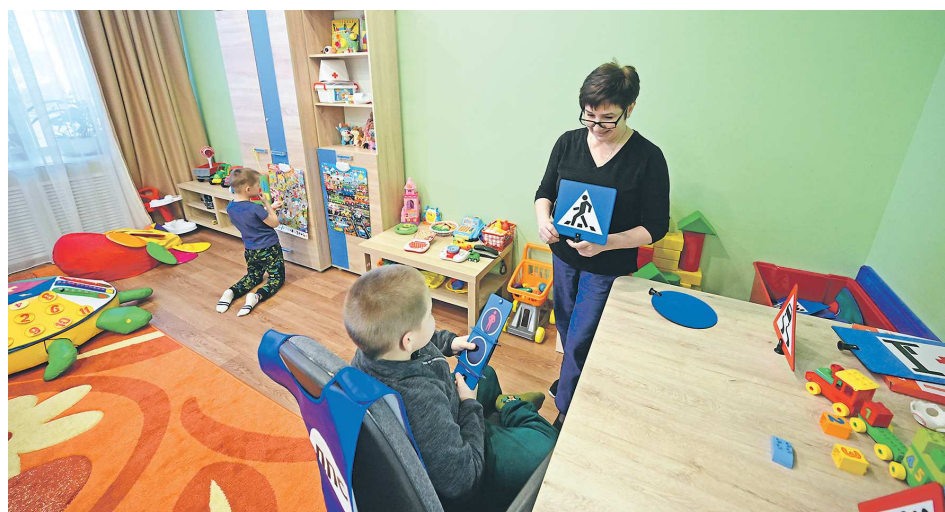
Воспитанников центра учат ориентироваться в городской среде, например, переходить дорогу по «зебре» и только на зеленый свет светофора