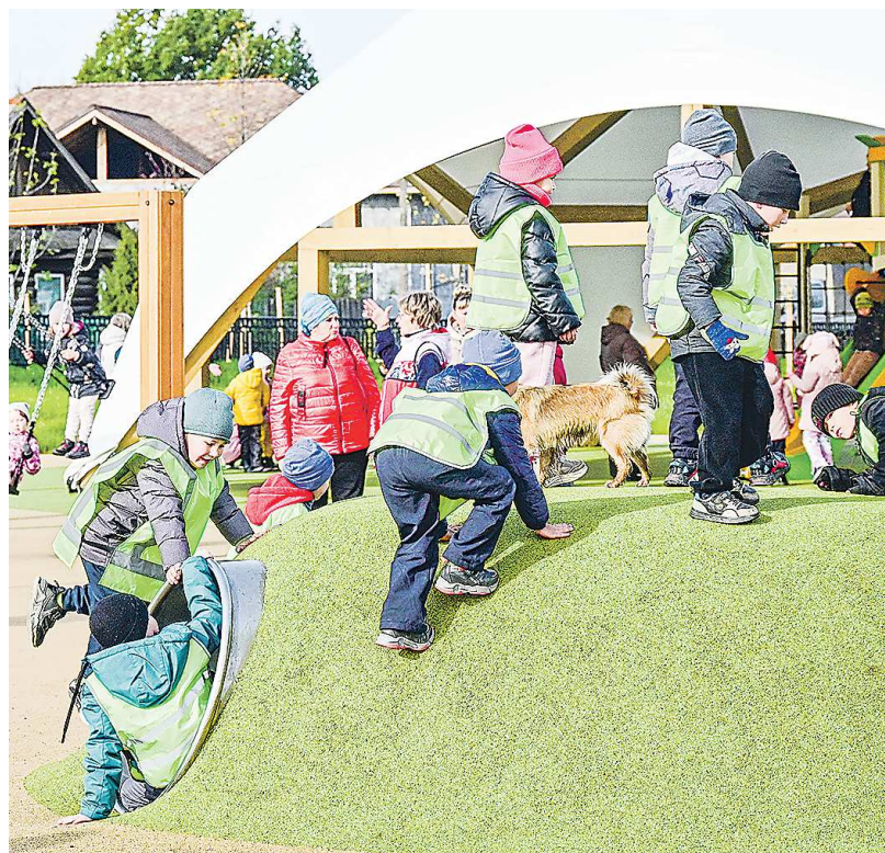
Создание комфортной городской среды остается одним из приоритетов при формировании бюджета