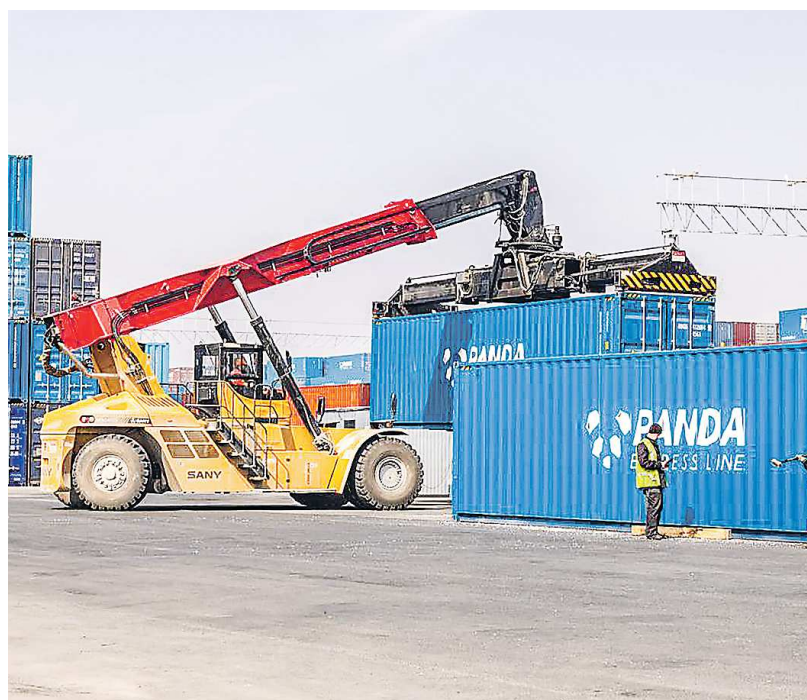
В бюджете предусмотрены расходы на разработку предпроектной документации «Сухого порта»