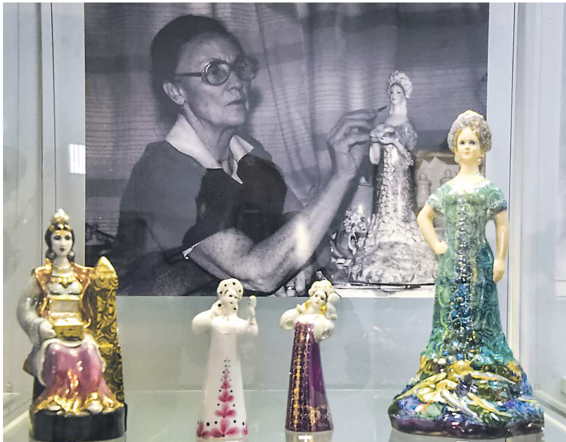
Выставка дополнена историческими снимками, где представлены мастера в процессе работы над произведениями