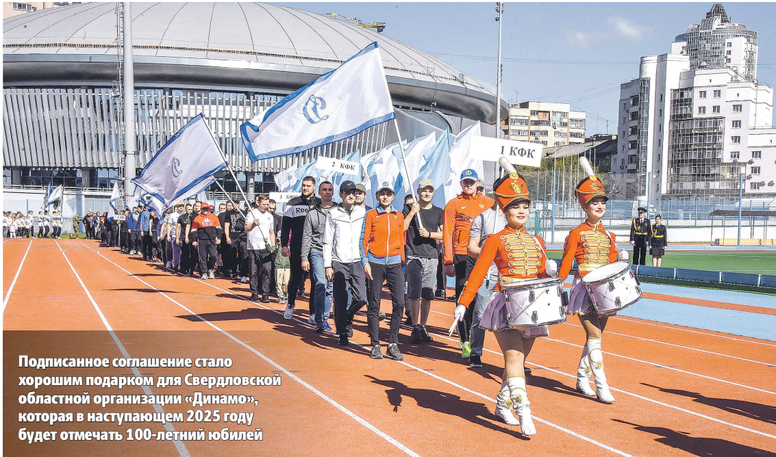
Подписанное соглашение стало хорошим подарком для Свердловской областной организации «Динамо», которая в наступающем 2025 году будет отмечать 100-летний юбилей