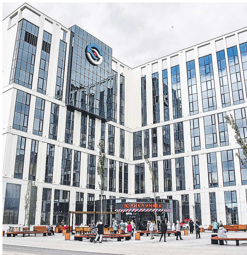
На 2025 год запланированы строительство и реконструкция девяти объектов здравоохранения

Исполнение принятого областного бюджета начнется с 1 января 2025 года.