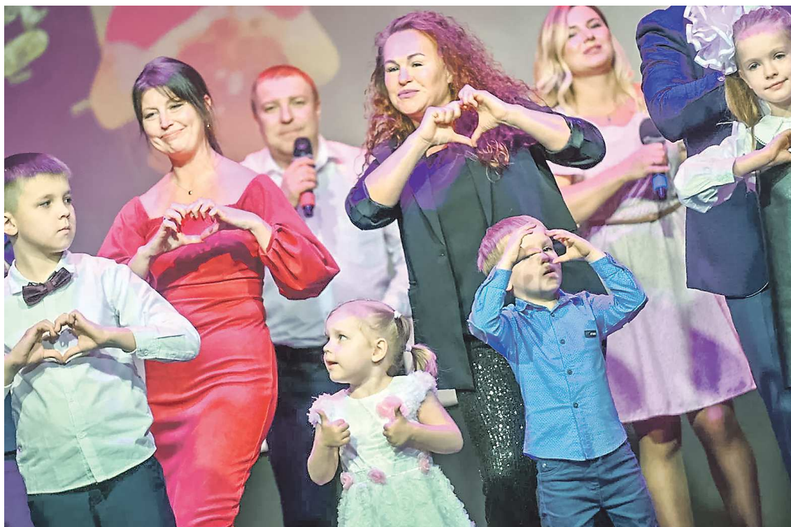
Победители конкурса «Семья года» исполнили для участников церемонии несколько песен

— За этот год сделано очень многое в плане поддержки семей с детьми. Наш Президент сказал, что укрепление института семьи — это не просто клю-