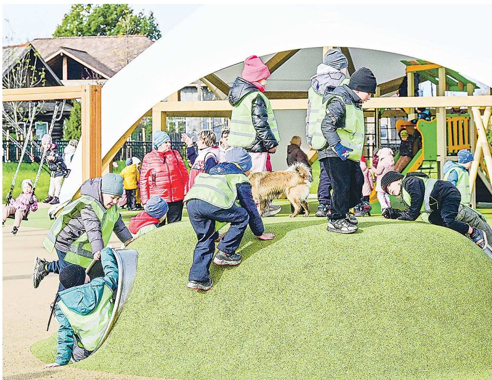
Создание комфортной городской среды остается одним из приоритетов при формировании бюджета

Исполнение принятого областного бюджета начнется с 1 января 2025 года.