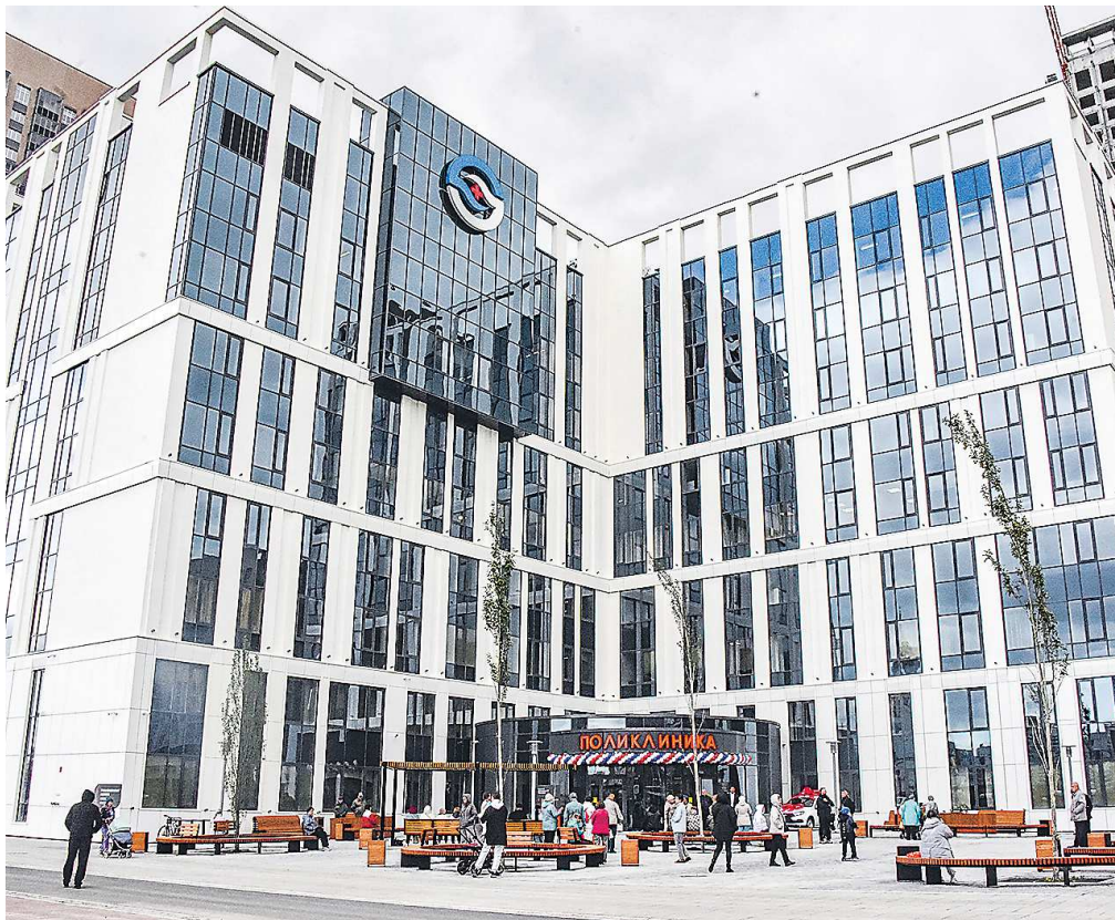
На 2025 год запланированы строительство и реконструкция девяти объектов здравоохранения