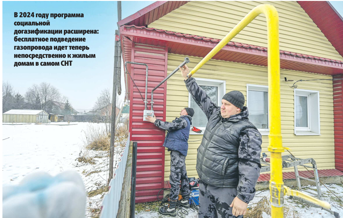
В 2024 году программа социальной догазификации расширена: бесплатное подведение газопровода идет теперь непосредственно к жилым домам в самом СНТ

Что касается некоммерческих садоводческих товариществ, то изначально строительство газопровода шло только до границ СНТ. Но в 2024 году по решению Президента РФ программа бы-