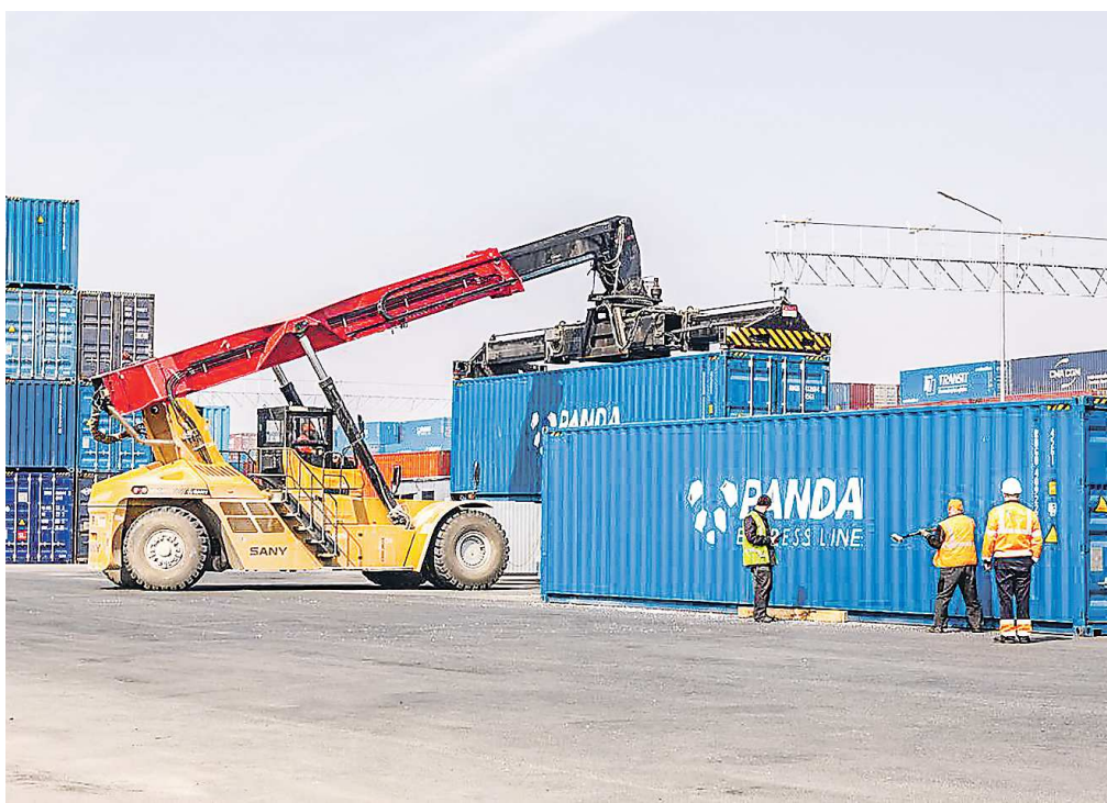
В бюджете предусмотрены расходы на разработку предпроектной документации «Сухого порта»

ДЕПАРТАМЕНТ ИНФОРМАТИКИ СВЕРДЛОВСКОЙ ОБЛАСТИ