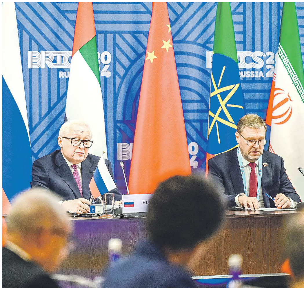
В числе участников заседания с российской стороны были замминистра иностранных дел РФ Сергей Рябков (слева) и вице-спикер Совета Федерации Константин Косачёв