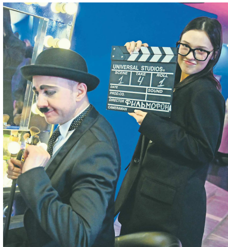
«Кинопроба» с Чарли Чаплином. Снимки останутся у каждого гостя на память и в архиве Дома кино

Славу уральского кино составляют фильмы, вошедшие в золотой фонд – «Сильва», «Угрюм-река», «Демидовы». Их до сих пор показывают. А кто показывает-то? Это прежде мы знали только киномеханика. Сегодня система кинопроката – целая империя: реставраторы, букеры... Молодеют названия, совершенствуется сам кинопрокат. Ведущий праздника в Доме кино, на киноаукционе, запустил в зал огромную бобину «со всеми уральскими фильмами». И она... взлетела. Как в кино. Обозначив старт регионального кинопроката в новое, второе столетие.