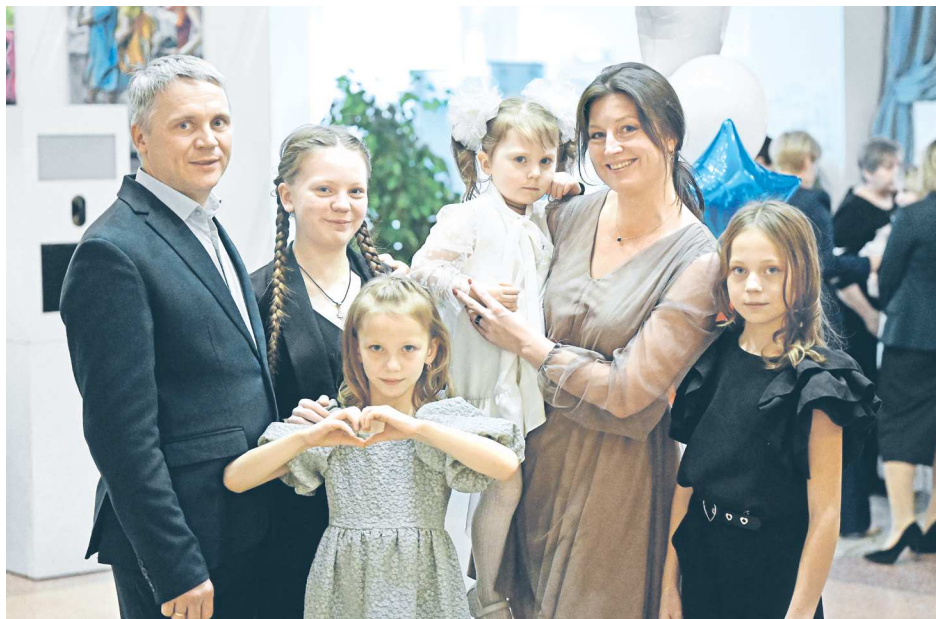
Семья Грдневых из Екатеринбурга признана «Семьей года»