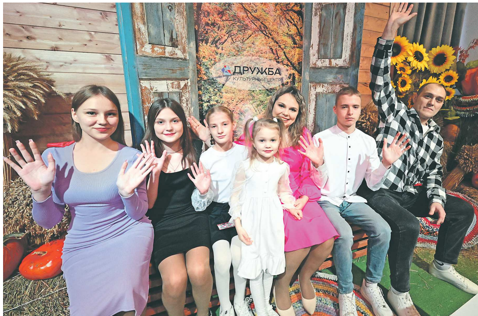
Семья Кротких из Краснотурьинска считает, что в этом конкурсе побеждает дружба