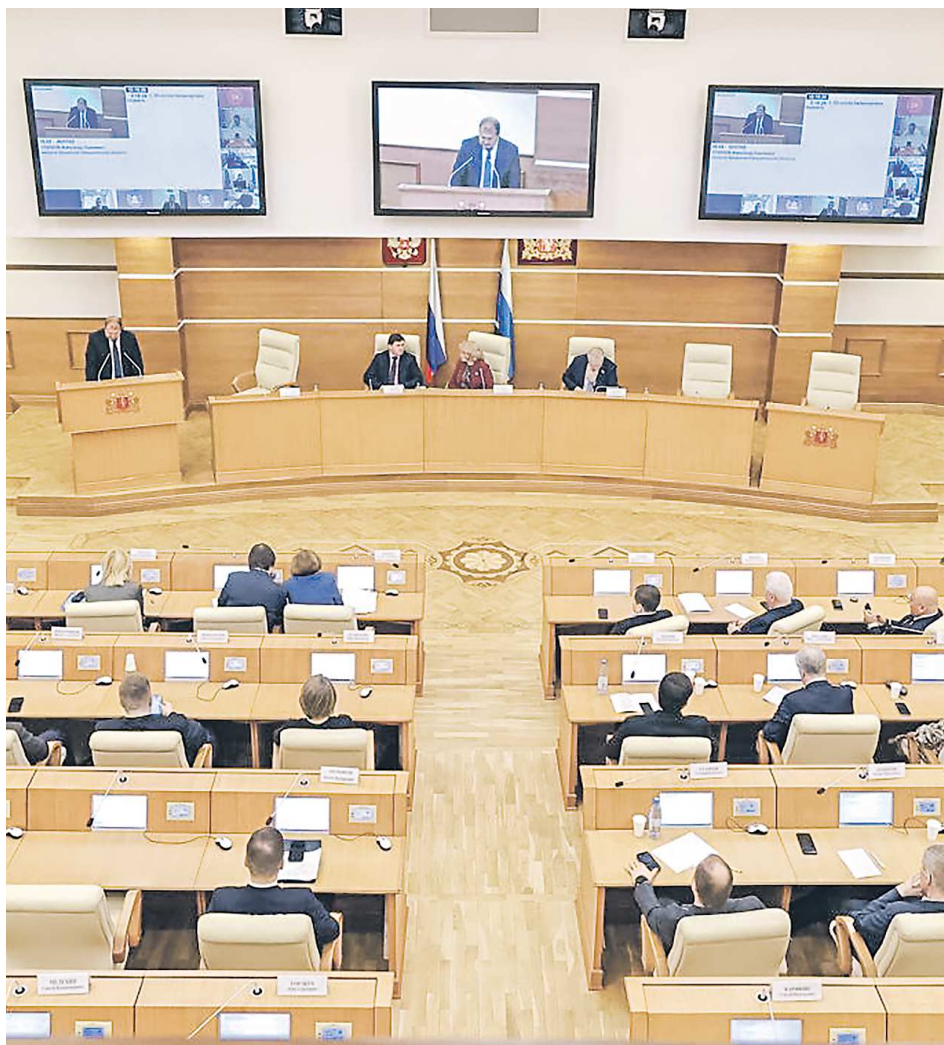
ПРЕСС-СЛУЖБА ЗАКОНОДАТЕЛЬНОГО СОБРАНИЯ СВЕРДЛОВСКОЙ ОБЛАСТИ