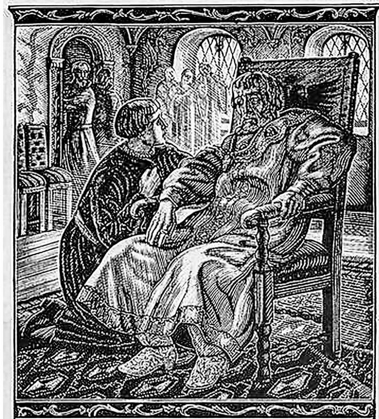
В. Фаворский. Иллюстрация к трагедии «Борис Годунов». Каждый открывает своего «царя Бориса». Каким он будет в оперной премьере?