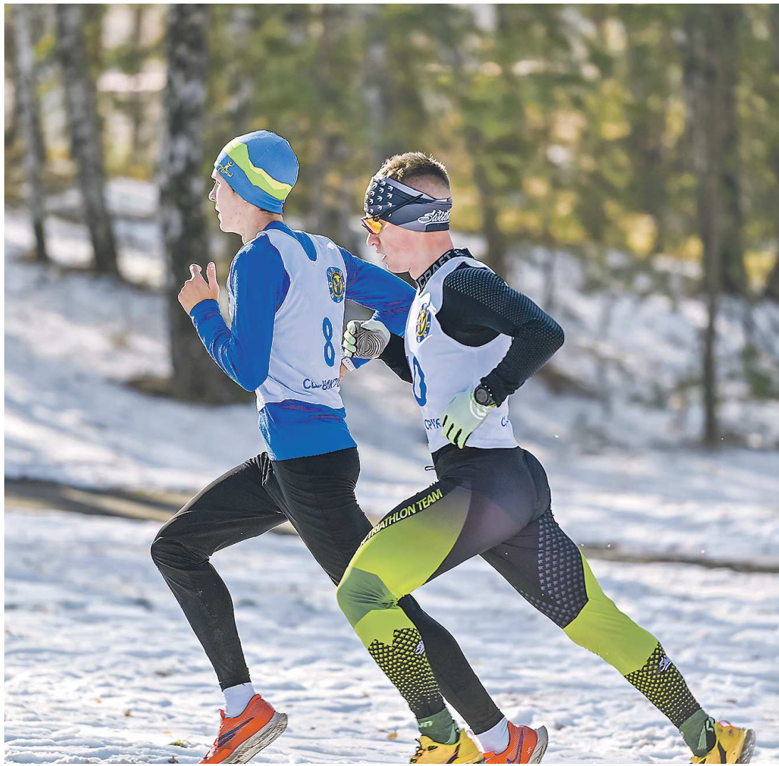
К подготовке к выполнению комплекса ГТО приобщена треть жителей региона

Напомним, в Свердловской области функционируют 89 организаций, наделенных полномочиями центра тестирования, определено 295 мест тестирования, соответствующих требованиям для выполнения нормативов комплекса ГТО. Доступность выполнения норм ГТО обеспечена по всей области. В регионе проект по внедрению норм ГТО активно поддерживает глава региона Евгений Куйвашев .