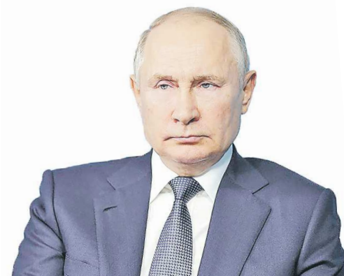
Владимир ПУТИН, Президент России

“Что хочу особо отметить, в эпоху технологической революции именно культурное, духовное наследие является ключевым фактором сохранения национальной идентичности, а значит, и многообразия нашего мира, устойчивости международных отношений.