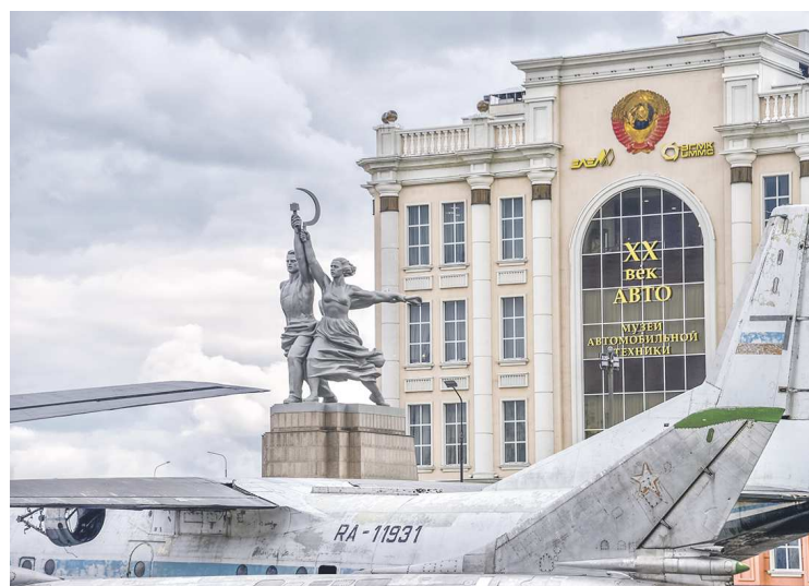
А второе место в конкурсе, по данным на 18.11.24, занимает Музей военной техники УГМК