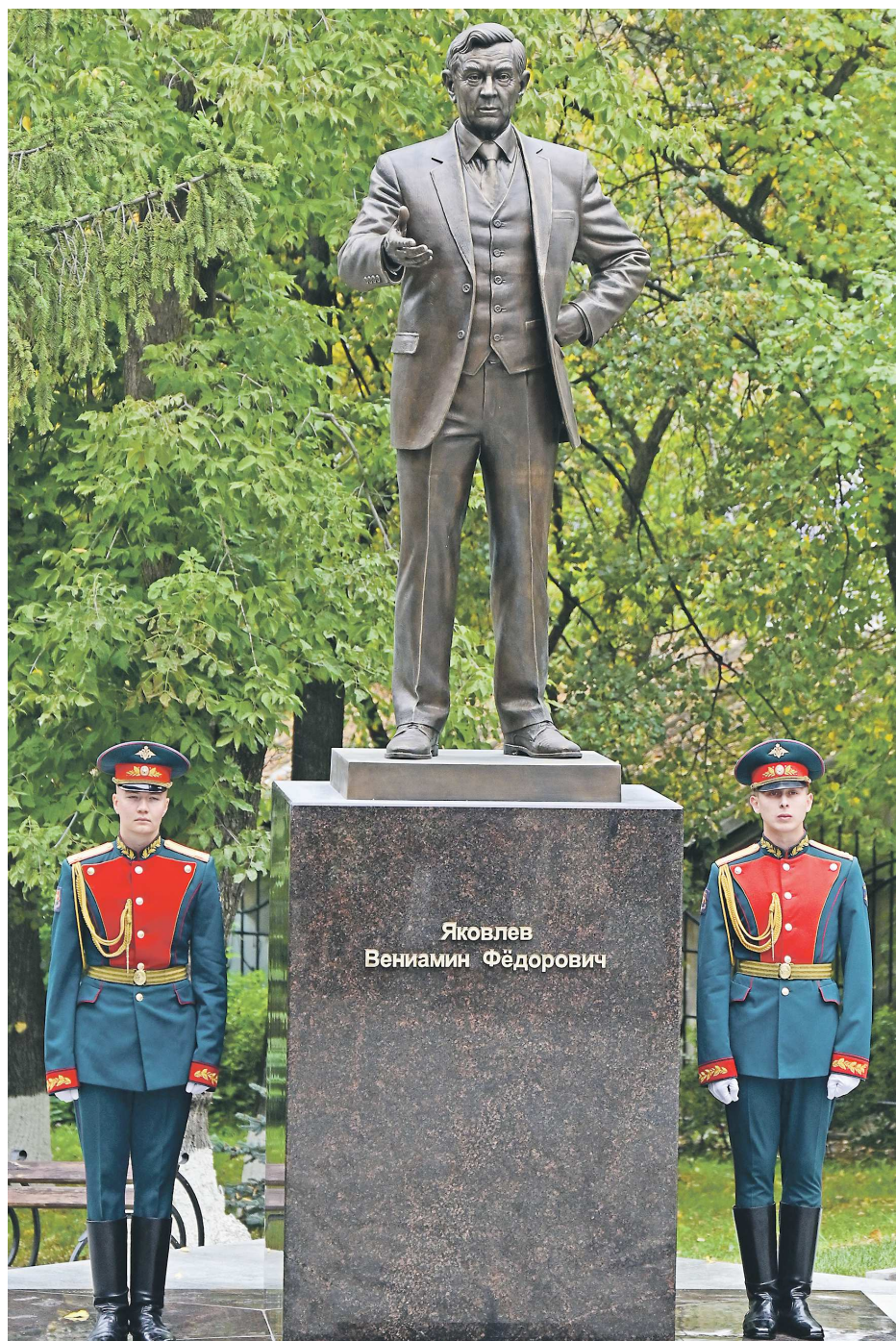
Одним из символов уральской юридической школы является соавтор Конституции РФ, бывший ректор УрГЮУ Вениамин Яковлев. В сентябре 2024 года у входа в вуз ему был открыт памятник

В 1976 году институт перешел на специализацию при подготовке юри-