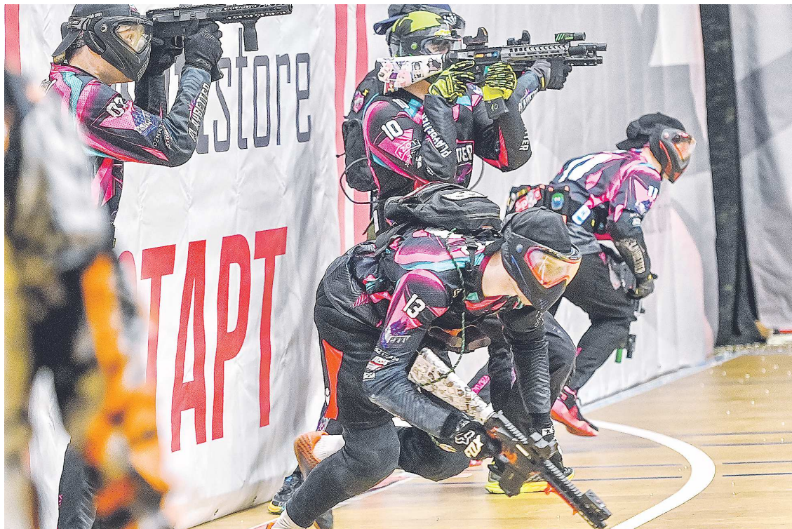
Соревнования по спидсофту в Екатеринбурге получились масштабными и зрелищными

– Многие команды, на которые мы смотрим, выросли, если сравнивать с первым турниром. Это связано с ростом популярности этого вида спорта: в регионах появляются все новые площад-