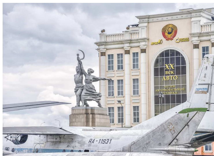
А второе место в конкурсе, по данным на 18.11.24, занимает Музей военной техники УГМК