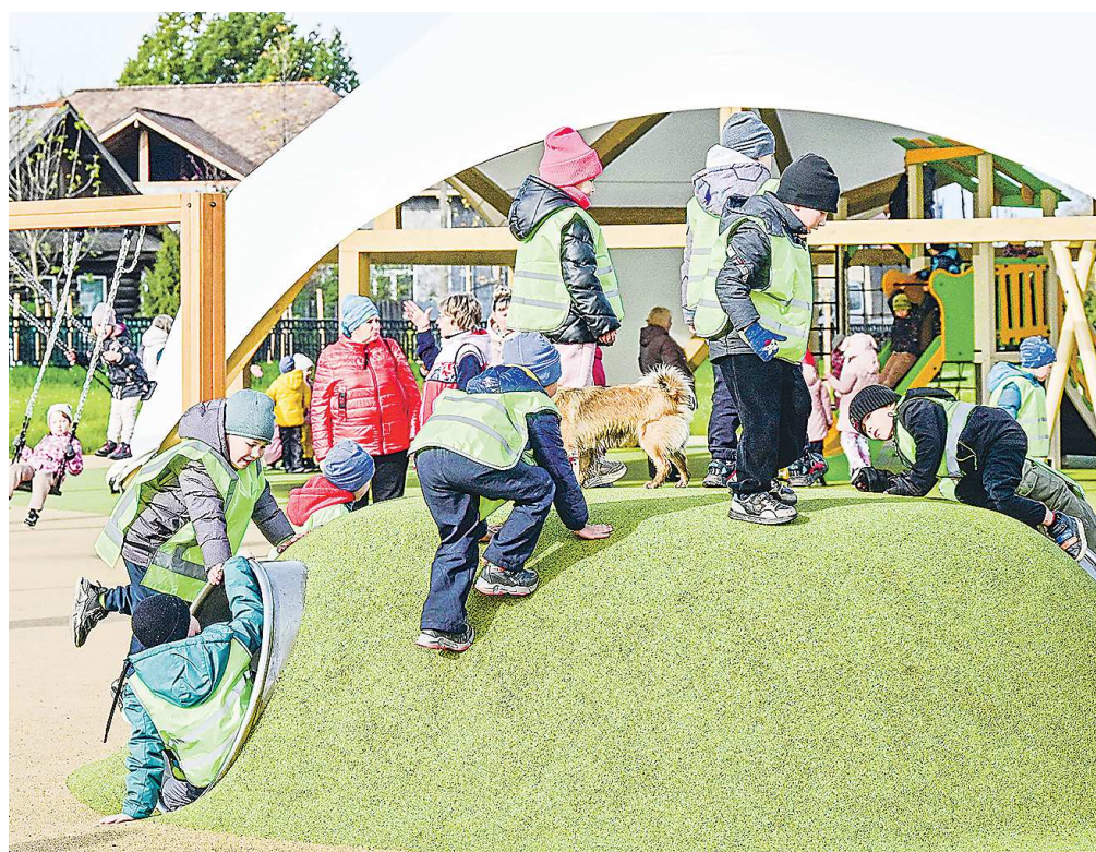
Создание комфортной городской среды остается одним из приоритетов при формировании бюджета