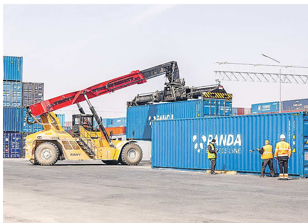
В бюджете предусмотрены расходы на разработку предпроектной документации «Сухого порта»

ДЕПАРТАМЕНТ ИНФОРМАТИКИ СВЕРДЛОВСКОЙ ОБЛАСТИ